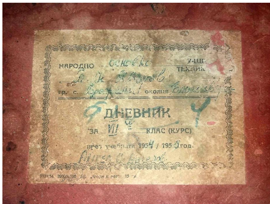
Слика бр. 1 – Корицата на дневникот