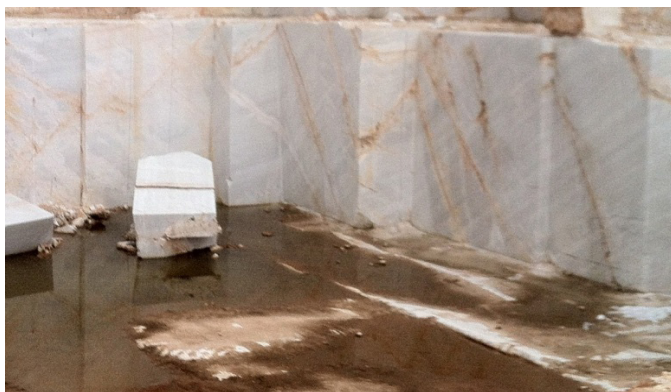
Слика 6. Масивни доломитски мермери Figure 6. Massive dolomitic marble

МЕРМЕРИТЕ ОД КАТЕГОРИЈА II го покриваат просторот над ката 900 па нагоре до врвот Чаве - Пештерица (Ореовец) на ката од 1.200 m надморска висина. На овој простор се јавуваат и калцитски и доломитски мермери. По боја се бели до бело-сивкасти до бело-розеникави. Тие покриваат еден простор со димензии од 800m x 250 m. Тие се релативно малку здробени, бојата им е бела до розеникаво - бела, финозрнеста до крупно зрнеста по структура.