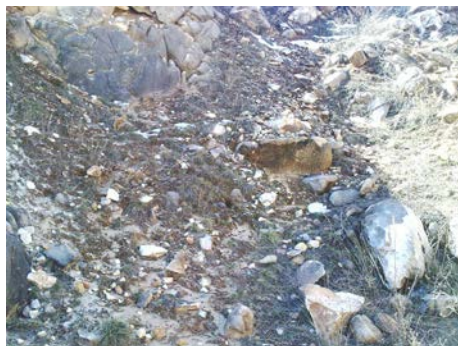
Слика 5. Дробински материјал Figure 5. Psephytic fragmented material

Хумусна покривка - Хумусниот материјал претежно е претставен со: хумус, доломитски песок и песокливи глини кои се сретнуваат на места каде што се појавуваат мали длабнатини, така што постоеле услови за распаѓање на доломитот. Дебелината на хумусната покривка изнесува од 10 до 120 cm, а на места како се оди во пониските делови на нејзината големина расте.