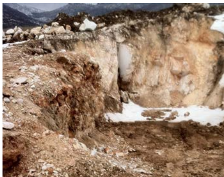
Слика 4. Здробен и милонитизиран мермер Figure 4. Crushed and mylonitised marble