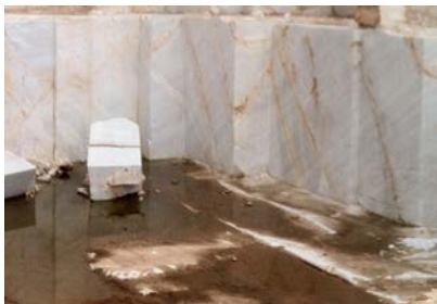
Слика 1. Компактни доломитски мермери

Бречите се јавуваат во форма на банци, во чиј состав влегуваат исклучиво парчиња, поретко облупоци од мермери. Цврсто се цементираны со железен варовнички цемент, што на карпите им дава многу голема цврстина (слика 2). Се претполага дека овие бречи, одејќи по централните делови на споменатите басени, преминуваат во бигори и бигорливи варовници. На истражуваното подрачје се констатирани во неговите западни и јужни делови.