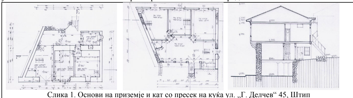
Слика 1. Основи на приземје и кат со пресек на куќа ул. „Г. Делчев“ 45, Штип

Историските записи преку прикажувањето на статистичките податоци за бројот на станбените објекти говорат за интензивен урбан развој и градителска дејност, каде што работеле голем број на градителски тајфи. Преку интензивирање на развојот на градот се зголемувала и потребата за градење на станбени објекти со конструктивни карактеристики приспособени на условите на Балканот и локалните разбирања за начинот на градење.