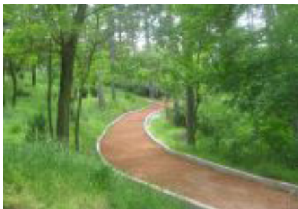
Слика 3 – Трим-патека во парк „Могила“ Figure 3 - Trim trail in the park Mogila