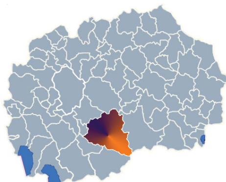
Слика 1 - Прилеп – Македонија Figure 1 - Prilep – Macedonia