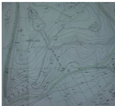
Слика 2 - Парк „Могила” Figure 2 - Park Mogila