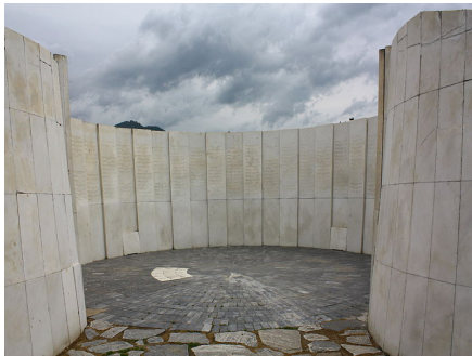
Слика 6 – Криптата - заедничката гробница Figure 6 - Crypt