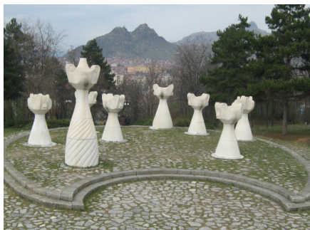
Слика 7 - Поглед кон четирите урни Figure 7 - Four urns