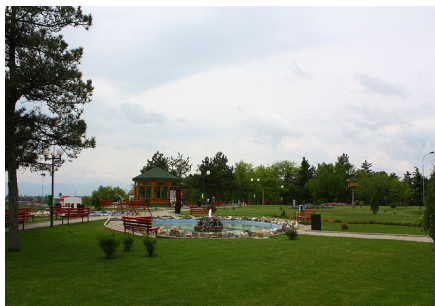
Слика 4 - Водна површина Figure 4 - Water surface