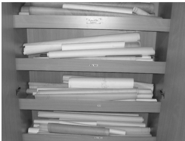
Слика 3. Печатење и чување на работни карти Figure 3. Printing and saving the working map

Иако со доза на недоверба зборуваме за картите и плановите од минатото, сепак тоа се прекрасни дела што се изработени со многу труд и точно одредени стандарди и правила, така што со сите свои предности и недостатоци и денес по потреба ги користиме во секојдневното работење.