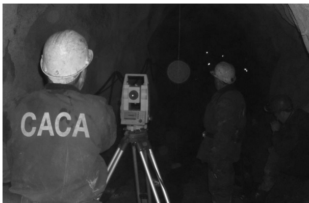
Слика 1. Тотална станица LEICA TCR 805 Figure 1. Total station LEICA TCR 805

Се брзиот развој на компјутерската технологија, како и во сите области на секојдневното, живеење неминовно донесе револуционерни промени и во геодезијата, и тоа како во геодетската мерна технологија, така и во обработката на резултатите од мерењата и начинот на нивното прикажување. Геодетските инструменти сами по себе претставуваат миникомпјутери и со својата брзина, точност и, пред сè, излезните податоци полека но сигурно овозможуваат прескокнување и забрзување на многу чекори што водат до крајниот производ на целата постапка, односно картите и плановите. Сите овие работи во голема мера ја олеснија работата на геометарот во рудниците и намалија голем дел од времето што е потребно да го помине во подземните ходници или на површинските терени за да ги изврши потребните мерења. Како главен претставник на новото време ќе ја наведеме Тоталната станица LEICA TCR 805 (слика 1), која целосно ги задоволува сите потреби на геометарот при вршењето на геодетските мерења во јама.