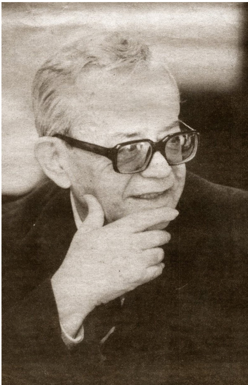
BLAZE KONESKI (1921–1993)