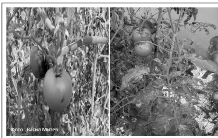
Слика 3. Оштетувања од минерот T. absoluta Figure 3. Damages caused by tomato leaf miner T. absoluta