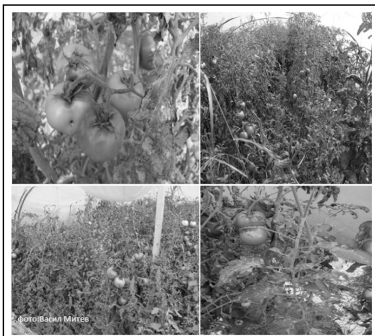
Слика 4. Оштетувања од лисниот минер T. absoluta Figure 4. Damages caused by tomato leaf miner T. absoluta