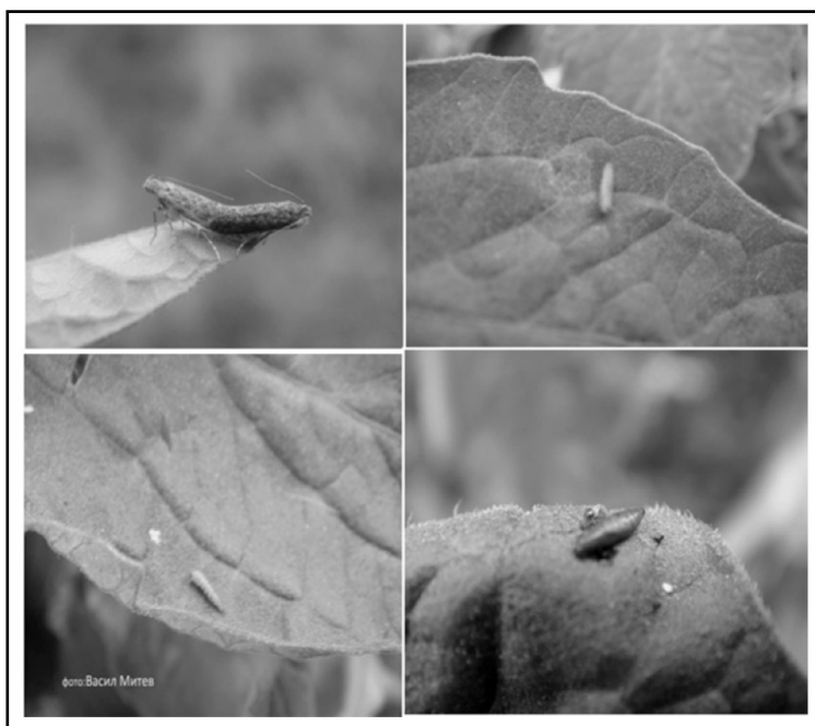
Слика 1. Минер Tuta absoluta Meyrick Figure 1. Tomato leaf miner Tuta absoluta Meyrick