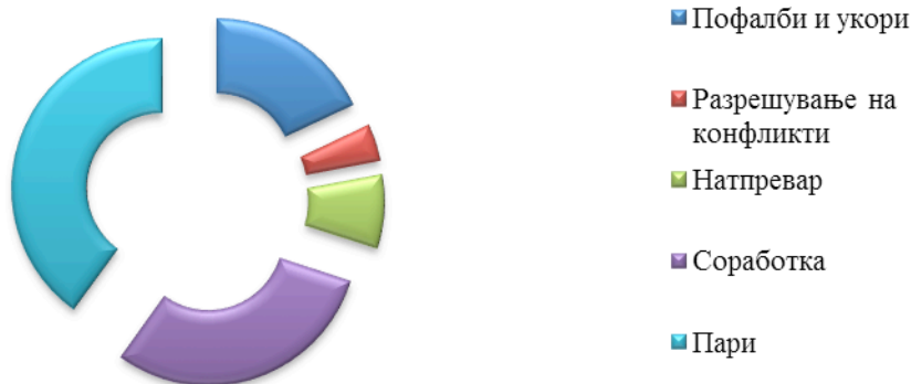
Слика 1. Фактори кои влијаат врз мотивацијата на вработените Figure 1. Factors that influence the motivation of the employees

Како што согледуваме најголем дел од испитаниците како најзначаен мотиватор за работа го сметаат факторот пари. За овој фактор се одлучиле дури 40% од анкетираниите вработени. Ваквиот резултат воопшто не е изненадувачки имајќи го предвид беневитот што го носи овој фактор. Меѓутоа, она што изненадува е дека добар процент т.е. 30%