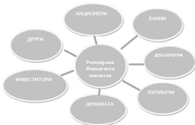
Слика 1. Корисници на финансиските извештаи

Ревизорите генерално се избираат од страна на акционерите и извештајот го доставуваат директно до нив. Сепак, ревидираните финансиски извештаи на повеќето јавно поседувани компании се јавно достапни до сите заинтересирани страни. Овие ревидирани финансиски извештаи, освен од акционерите, може да се користат и од други заинтересирани страни, како што се потенцијалните инвеститори кои размислуваат да купат акции од компанијата или добавувачи кои размислуваат да соработуваат со компанијата. Ригорозниот процес на ревизија речиси секогаш ќе укаже на одредени делови од работењето во кои може да се направи некое подобрување во контролите или процесите. Во одредени околности можеби ќе биде потребно ревизорот да комуницира со менаџментот доколку увиди дека има недостаток од контрола во одредени делови од работењето. Овие комуникации можат да придонесат за додавање на вредност на компанијата и да придонесат за подобрување на целокупното работење. 7