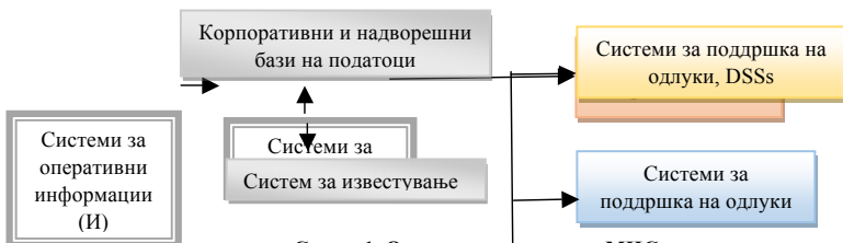
Слика 1. Основни елементи на МИС Figure 1. Basic elements of MIS

во организацијата, иако со вмрежувањето на сите создадени системи сите вработени се инволвирани во процесот.