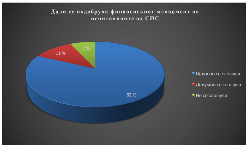
Графикон бр. 2: Резултати на анкетираниите лица за подобрувањето на нивното работење од имплементација на СИС