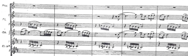
Слика 2. Фрагмент од првата балетска сцена – Andante cantabile (25 – 29 такт)

Хомофона фактура – со изразена и богата симфонизација, пренесување на музичката мисла во различни инструменти, се создава и определено мелодиско контрапунктско движење во придружните гласови (соло обоа во придружба на втора флејта и прв кларинет).