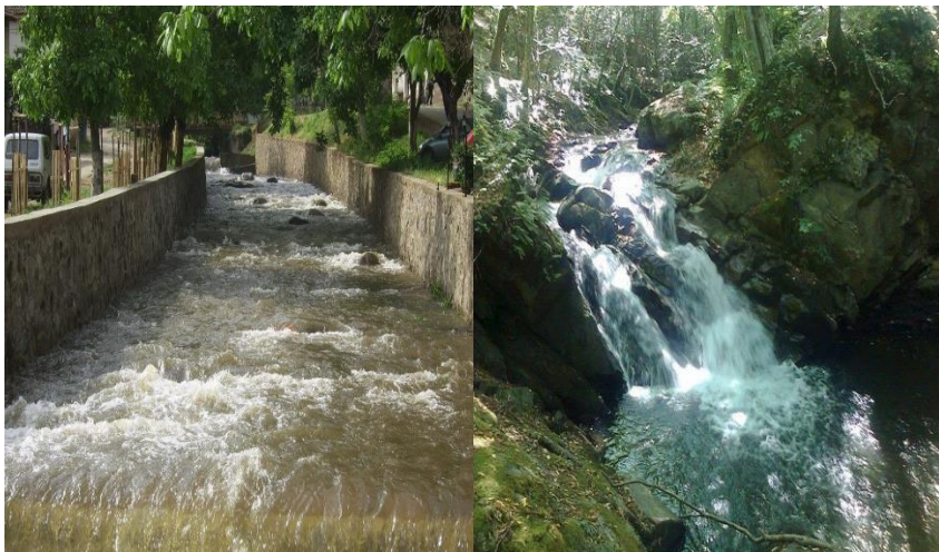
Слики 3 и 4. Зрновска Река

Низ Зрновци минува Зрновска Река која е со извонредно квалитетна и чиста вода и е богата со флора и фауна. Таа претставува една од побогатите со вода притоки на Брегалница. Реката извира под врвот Козобран, во месноста Бачалија (на Плачковица) на надморска височина од 1.420 м. Сливното подрачје на Зрновска Река изнесува 70 км 2 , а должината 24 км. Располага со 14 мг О 2 /л и е од рангот на реката „Радика“. Благодарение на потенцијалот на река Зрновка, во близина на селото е изградена и една од првите хидроцентрали во Македонија (1950 година), ХЕЦ Зрновци. Течението на реката води низ живописниот кањон, кањонот „Улумија“ на реката „Зрновка“. Кањонот започнува под врвот „Лисец“, а завршува во близината на Зрновци и потребни се околу 6 часа за целосно да се премине. По кањонот ќе најдете на водопади, вирови и базени, а дополнително може да се посетат и 4 природни пештери. Пештерата „Голема“ се вбројува меѓу потешките пештери во Македонија и бара познавање од спелеологија и добра физичка подготвеност, додека останатите пештери стојат на располагање за сите посетители. Реката „Зрновка“ е и извор на чиста вода за наводнување на познатите оризови полиња, а во денешно време и за останатите земјоделски производи. Во другите две населени места исто така поминува река и тоа во Мородвис минува Морошка Река, а во село Видовиште минува Видовишка Река. Водите од овие две реки исто така се користат за наводнување на земјоделските површини во тие простори.