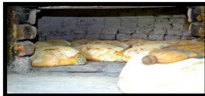
Слики 5, 6, 7 и 8. Гастрономија