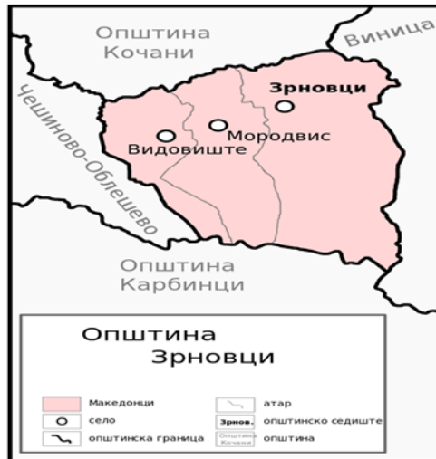
Слика 1. Општина Зрновци