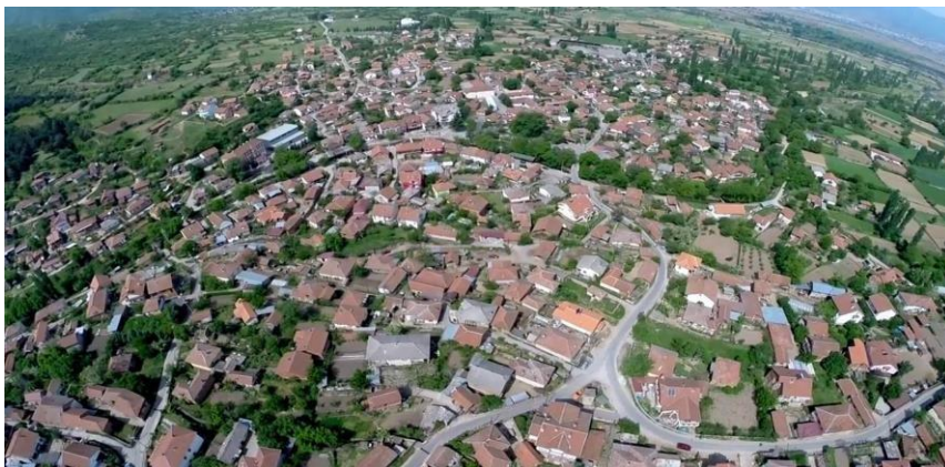
Слика 9. Панорама на општина Зрновци

Од тоа може да се заклучи дека општина Зрновци е една од многуте вакви средини во Република Македонија која поседува многу големи потенцијали за развој на руралниот туризам. Ова е простор на кој вреди и треба да се инвестира за да се привлечат голем број туристи и со тоа да се даде значење на овој вид туризам во нашата земја.