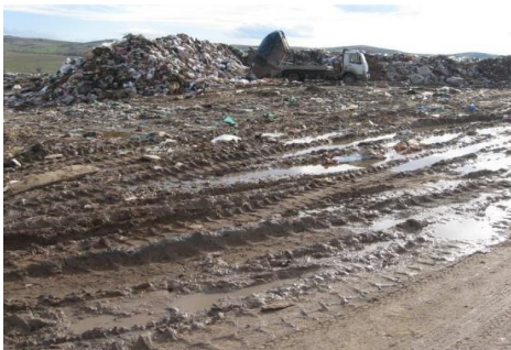
Слика 5.: Депонија „Алинци“