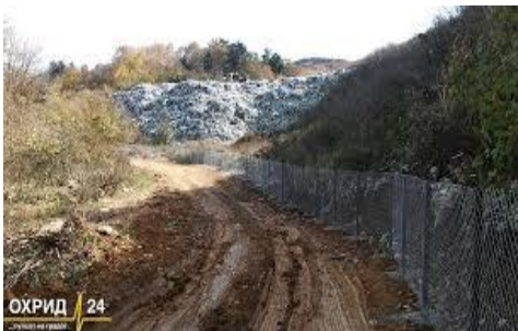
Слика 3.: Депонија „Буково“