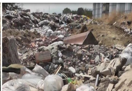
Полошки регион - постоечка