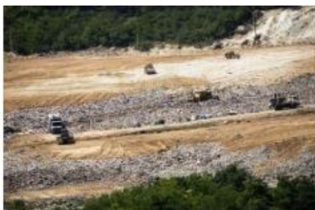
Скопски регион - постоечка