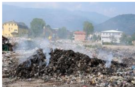
Слика 8.: Депонија „Краста“

Југоисточен регион - планирана (неостварена)