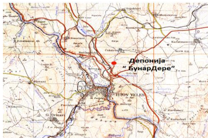
Слика 4.: Депонија „Бунар Дере“