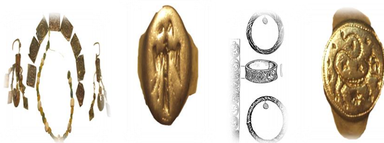
Слика 5.: Вредни предмети пронајдени на археолошкиот локалитет

Археолошкото наоѓалиште „Црквиште“ е откриено во 1980 год. Попознато е како средновековен град Моробиздон кој еден милениум бил културен, економски, црковен и политички центар на Источна Македонија. Со научните истражувања на овој простор откриени и сочувани се четири цркви од кои најстарата е од 5-ти век, а најмладата е од 13-ти век. Според начинот на градбата, мермерниот под и столбовите и капителите со претстави од средновековни мотиви, утврдено е дека станува збор за едно високо ниво на техника на градење и украсување. Од времето на големиот просперитет на градот, како на економско-политички, така и на културен план, откриена е катедралната црква репрезент на средновековната архитектонска концепција, фрескописана со под изработен во техниката секстиле и црковен мебел од делкан камен. Со истражувањето откриено е дека во оваа црква во XIII век била изградена нова помала црква околу која е откриена некропола од XII до XIX век со повеќе од 350 гробови во кои се пронајдени предмети од сребро, бронза, коска, стакло и текстил.