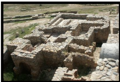
Слики 2. и 3.: Големата и малата терма на градот Баргала

Малата терма е изградена на тесниот простор помеѓу просторијата за ложење. Термата има правоаголна основа со должина 4.55 м и широчина 3.00 м.