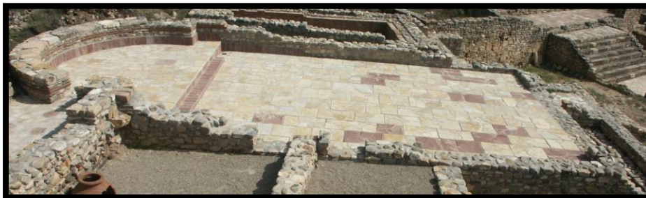
Слика 1.: Главната сала на Епископската резиденција