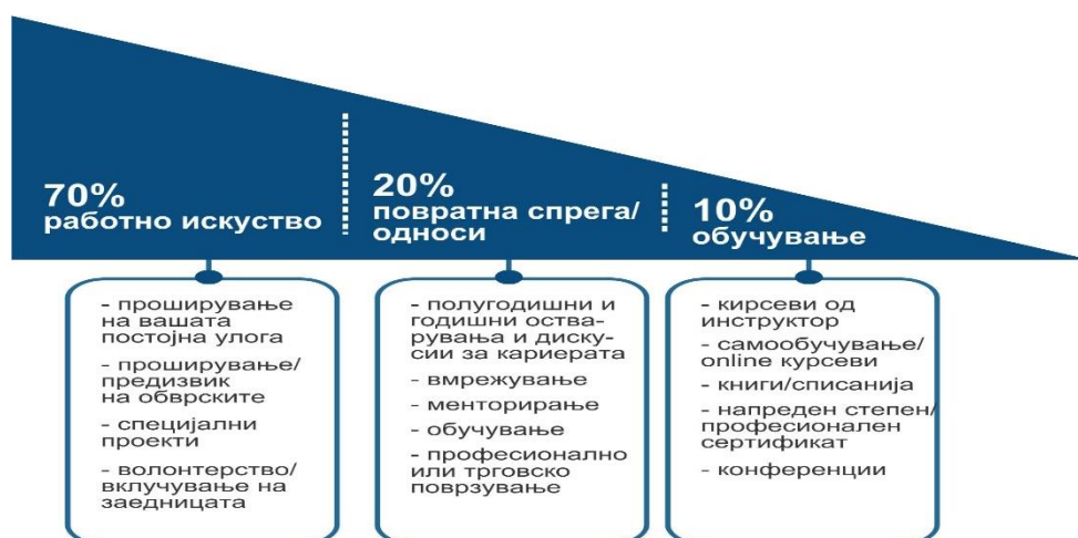
Слика 1: Начини на пренос на знаења