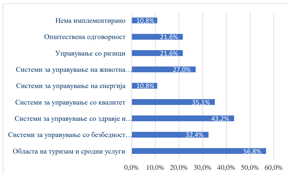
Фигура 2: Процент на имплементирани стандарди од областа на Туризам и сродни услуги