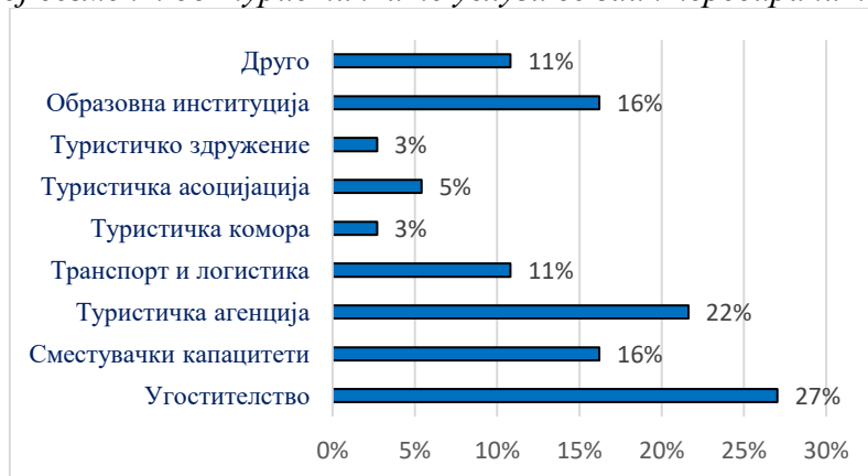
Фигура 1: Во кој сегмент од туристичките услуги се заинтересираните страни