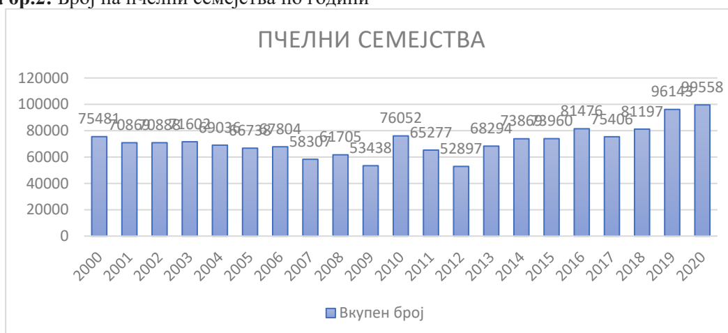
Табела бр.2: Број на пчелни семејства по години

Пчеларството во регионот на Шар планина иако има природни ресурсите, а особено медна вегетација кои овозможуваат да се даде чиста, квалитетна мед, матичен млеч, полен, прополис, пчелин восок, пчелен отров и други пчелни производи, сепак останува претежно хоби. Мал број на пчелари успеаја да градат вистински фарми иако државата уште во 2010 год. има дадено предлог програма за подршка на пчеларството меѓу кои може да се спомне финансиската подршка по регистрирано презимено пчелно семејство, финансиска подршка за подигање на нови површини под медоносна флора ( костен и багрем) и сл.