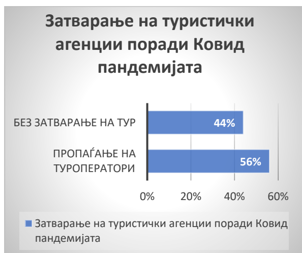
Графикон 1 – Затварање на туристичките агенции поради ковид пандемијата