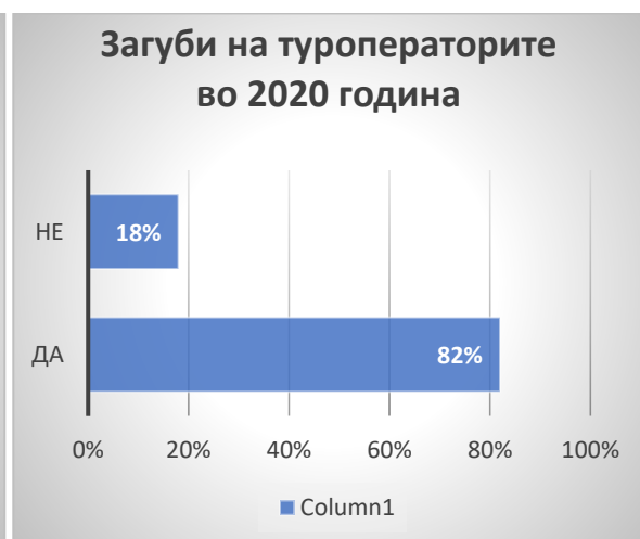
Графикон 2 – Загуби на туроператорите во 2020 година

Согласно спроведеното истражување за поставената тематика на овој труд може да се истакне дека 56% од испитаниците истакнале дека сметаат дека во 2020 година се затвориле многу туристички агенции на територијата на нашата држава. Дури фрапантни 82% се изјасниле дека во 2020 година претрпеле големи финансиски загуби поради неможноста за патување и организирање на аранжмани.