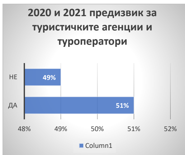
Графикон 3 – 2020 и 2021 предизвик за туристичките агенции и туроператори

Согласно спроведеното истражување за поставената тематика на овој труд може да се истакне дека 56% од испитаниците истакнале дека сметаат дека во 2020 година се затвориле многу туристички агенции на територијата на нашата држава. Дури фрапантни 82% се изјасниле дека во 2020 година претрпеле големи финансиски загуби поради неможноста за патување и организирање на аранжмани.