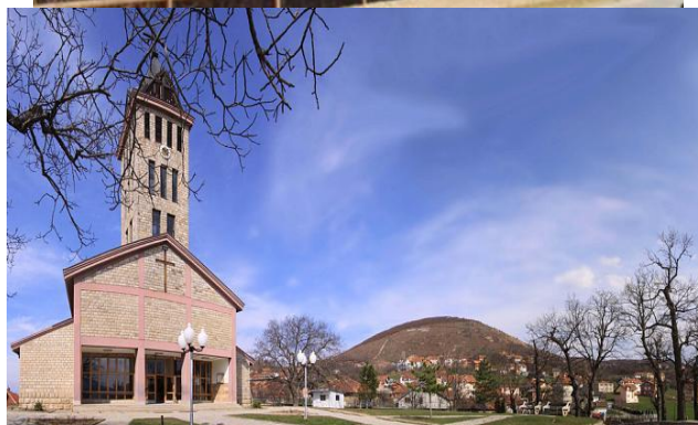
Слика 2: Џамијата на селото Гермова (околу 1827 година) и црквата Свети Јосиф во Горно Стубеле.