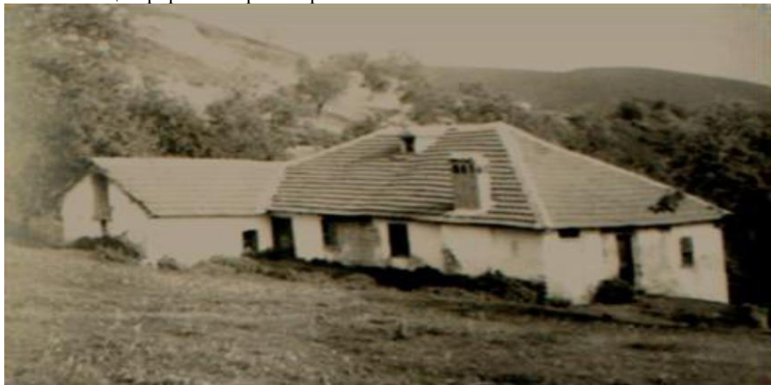
Слика 1: Прво училиште на албански јазик - Стубел - Општина Вити

прашањата, важноста. Улогата на настаните е да привлечат посетители во област во која вообичаено не би патувале. Покрај тоа, тие можат да патуваат до одредена дестинација по завршувањето на настанот или манифестацијата и на тој начин да создадат нова дестинација како вредност. Меѓу другото, има многу факти кои се манифестирани, дека немаат никаква врска, а посетителот мора да биде физички присутен за да ужива во друштвото. Тие се случуваат само еднаш годишно, за разлика од другите туристички настани, што значи дека туристичките движења се концентрираат во кратко време.