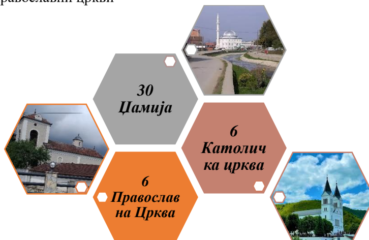
Слика 1: Верски предмети во Вити

Дваесет и двајца (22) од нив се под привремена локална заштита. Многу од сегашните џамии се реновирани. Православните цркви сè уште се во употреба на српската заедница, тие се наоѓаат во селата Бинче, Вербовц, Могила и во градот Витија.