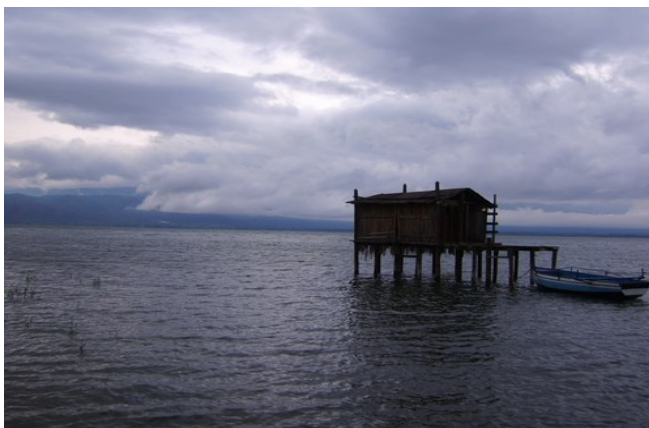
Сл. Рибарска наколна колиба во Дојран