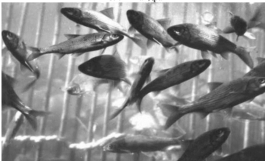
Сл. 2 Риби во мандра