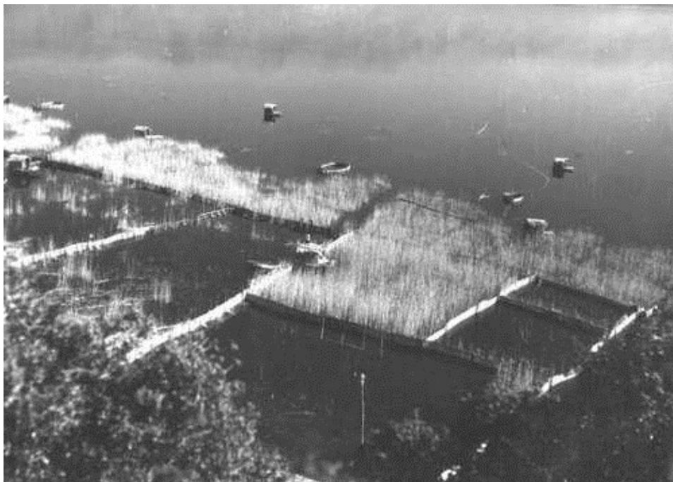
Сл. 1 Мандра

12.Ivanović-Barisić M., 2012, Ethnological heritage in function of cultural tourism in Serbia, Етнолог бр. 14, Македонско етнолошко друштво, Скопје