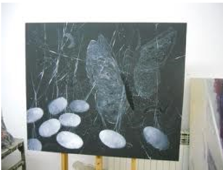
Сл. 6 Кожурци од свилена буба