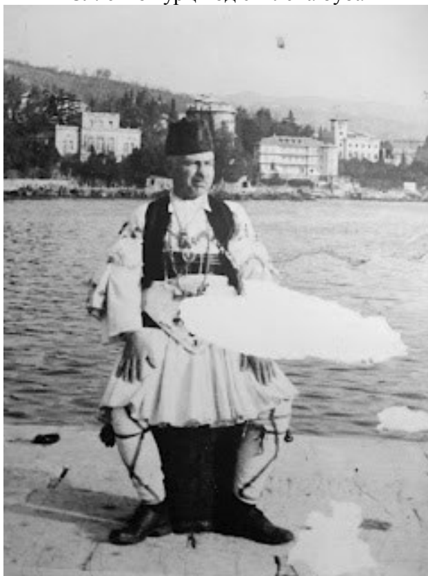
Сл. 7 Русалија во Дојран во 30-те години од XX век.