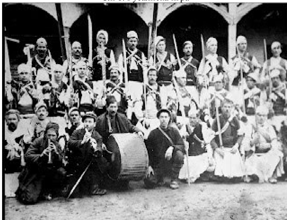
Сл. 9 Русалиска дружина во првата половина на XX век.