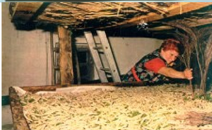
Сл. 4 и 5. Жени огледаваат Свилена буба на традиционален начин