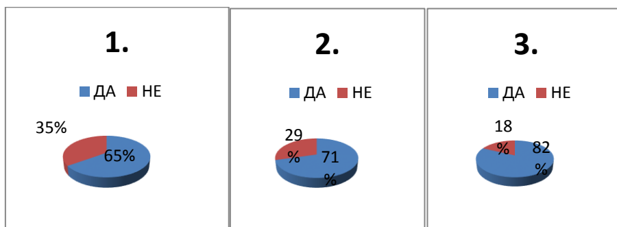
График 1- Графички приказ на резултатите од спроведеното истражување за формалното образование и професионалното вработување во малите претпријатија

На последното прашање - Во кои вработени имате поголема доверба, дали во вработените кои имаат работно искуство или во вработените кои имаат формално образование?, 56 претприемачи се изјаснија дека имаат доверба во вработените со поголемо работно искуство за разлика од вработените со оформено формално образование во кои 39 претприемачи имаат поголема доверба. Графичкиот приказ на опсервациите од добиените добиените одговори се прикажани подолу.