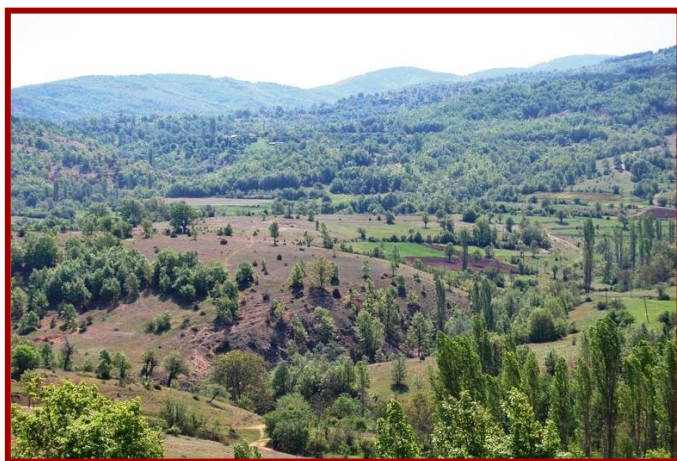
Сл.4 Градиште - Драмче

Градиште претставувало рудничко утврдување лоцирано на 1,5 км од селото Моштица. Сместено било на 100 метри висока купа на работ на долината на Каменичка