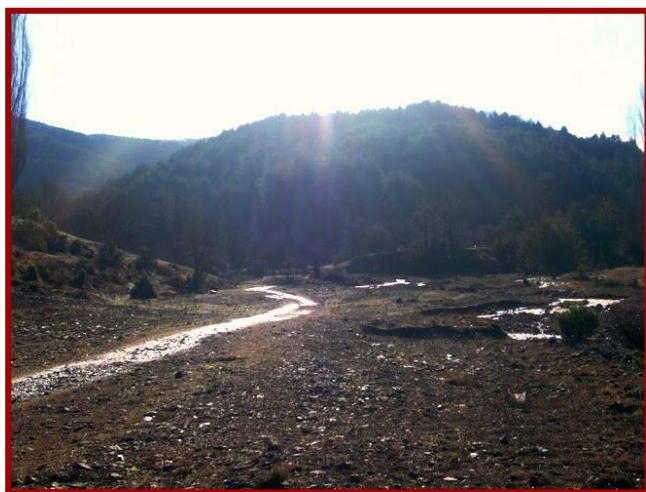
Сл.3 Градиште -Панчерово

Буковиќ кое претставувало рударско утврдување е лоцирано на 3 км источно од Пехчево, на една височинка на зарамнето плато. Кај одбранбените ѕидини на ова