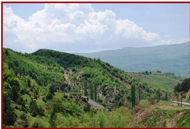
Сл.6 Мало Градиште - Свегор

На висок рид кој се издига на североисточниот раб на с.Град се наоѓа Градо .