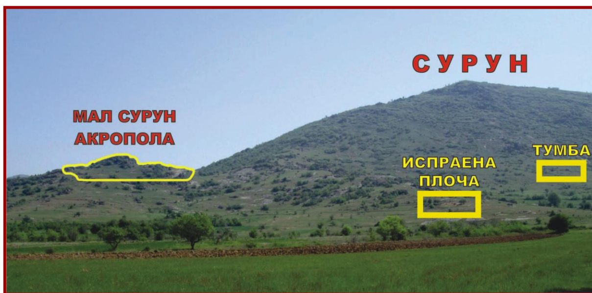
Сл. 1 - Поглед на локалитетот Мал Сурун од запад

На археолошките наоѓалишта позиционирани во карпести предели, се среќаваат делкања, вдлабувања и други интервенции во карпи. Вообичаено се дефинираат како прилагодувања на карпите во рамки на одредени градби. Врз основа на ова шаблонизирано толкување, при археолошките истражувања не им се придава особена важност. Засекувањата во вертикала и хоризонтала, гледано од градежнички аспект, најверојатно и биле во функција на одредено прилагодување на карпите како делови од градби. Но, вдлабувањата во вид на јами, сепак можат да бидат предмет на поаналитички размислувања околу нивната намена. Јамите претставуваат мошне распространета појава на археолошките наоѓалишта. Покрај како вдлабувања во карпи, често се јавуваат во рамки на земјените културни хоризонти и тоа од сите временски периоди, од предисторијата сè до средниот век. Присутни се во различни форми, димензии и длабочини, а според движните археолошки материјали евидентирани во нив и според позиционираноста во однос на други архитектонски појави, се определуваат како култни или како јами за складирање на прехранбени производи или отпад. Кога се појавуваат на карпи без очевидно нивно поврзување со некаква градба (на мала и нерамна површина или на карпа со изолирана, но во исто време доминантна висинска позиционираност), веројатноста за нивна култна намена е мошне возможна.