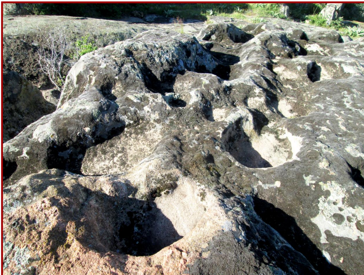
Сл. 7 - Јами

Кон запад од платформата се следи природниот пад на карпата со нерамна површина на која има голем број на вдлабувања со кружни, овални или неправилни