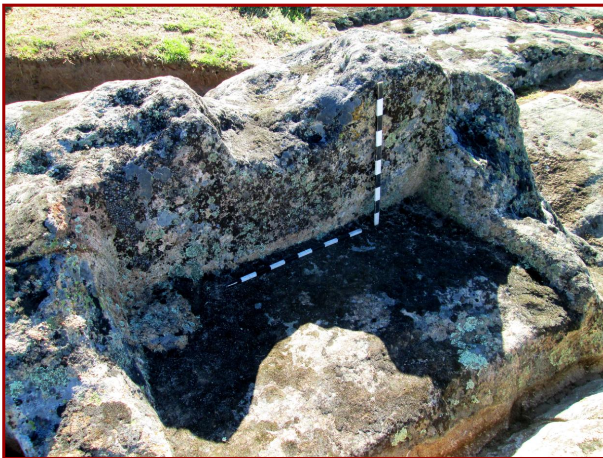
Сл. 6 - Карпа „Престол“

Додека вдлабувањата во карпата со облици на машки и женски симбол имале одредена улога во насока на успешно зачнување, во правоаголното корито меѓу нив можно е да се вршела процесција на ритуално капење на новороденчето на истото место кое е „заслужно“ за неговото раѓање. Откриените остеолошки остатоци на мало дете, веројатно мртвороденче, може да е симболична молитвена жртва за одбегнување на повторна појава на мртвороденче во иднина.