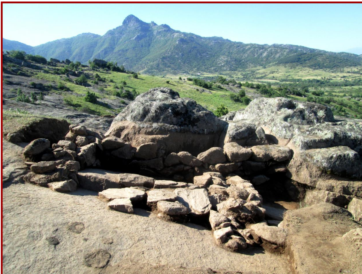
Сл. 9 - Градба од северната страна на карпата

И од спротивната, јужната страна на карпата, се евидентира еден на неа паралелен ѕид од плочести делумно делкани камења, но не така компактен како ѕидовите од просторијата од северната страна. Сочуван беше во должина од 3,10 м. и е со средна ширина од 0,40 м. Во неговиот краен источен дел се констатира мошне дебел слој на горена земја и мноштво метална згура.