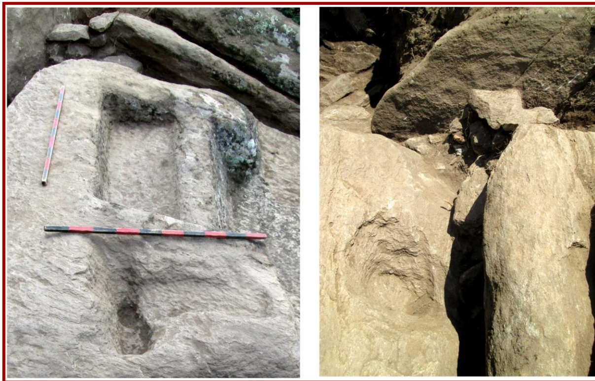
Сл. 4 – Светилиште – вдлабувања

поретки наоди, меѓу кои се издвојуваат еден фрагмент од сад декориран со ленти изведени со убоди и масичка на две нозе со приближно правоаголен плиток реципиент, додека бронзенодопскиот движен материјал е мошне богат и се состои од садова керамика со типични облици: големи конусни чинии со вовлечен горен дел, садови декорирани со хоризонтални плетеници, широки лентести држалки и држалки со јазичеста, односно правоаголна форма.