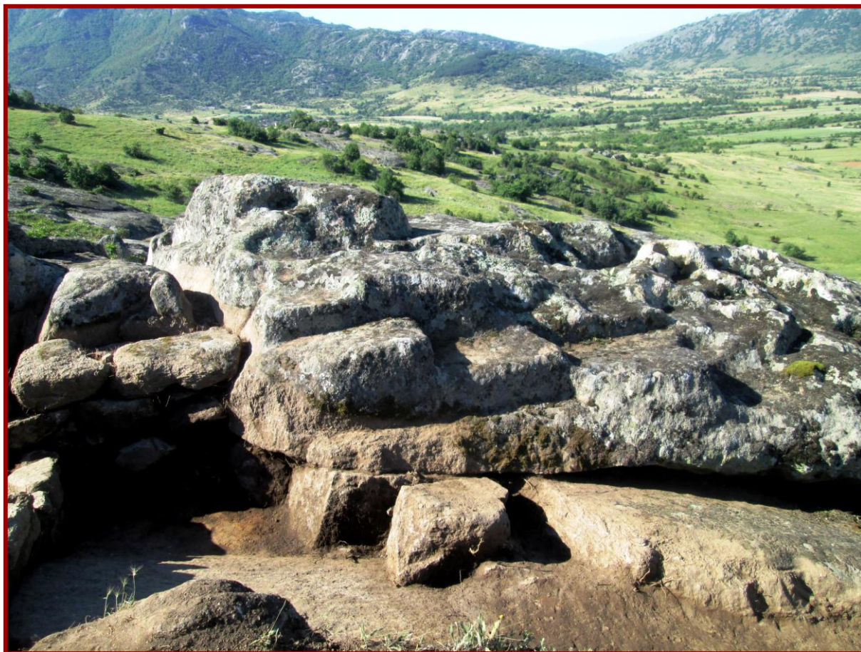
Сл. 8 - Скалишни форми

форми и различни далбочини. Некои од нив се каскадно поврзани. Веројатно станува збор за систем од култни јами (Сл. 7). Од северната страна карпата била прецизно скалесто изделкана. Можеби тоа бил скалиштен приод кон култниот простор, но можно е едноставно карпата во тој дел да била прилагодена за налегнување на камени блокови како дел од некакво сидно преградување (Сл. 8).