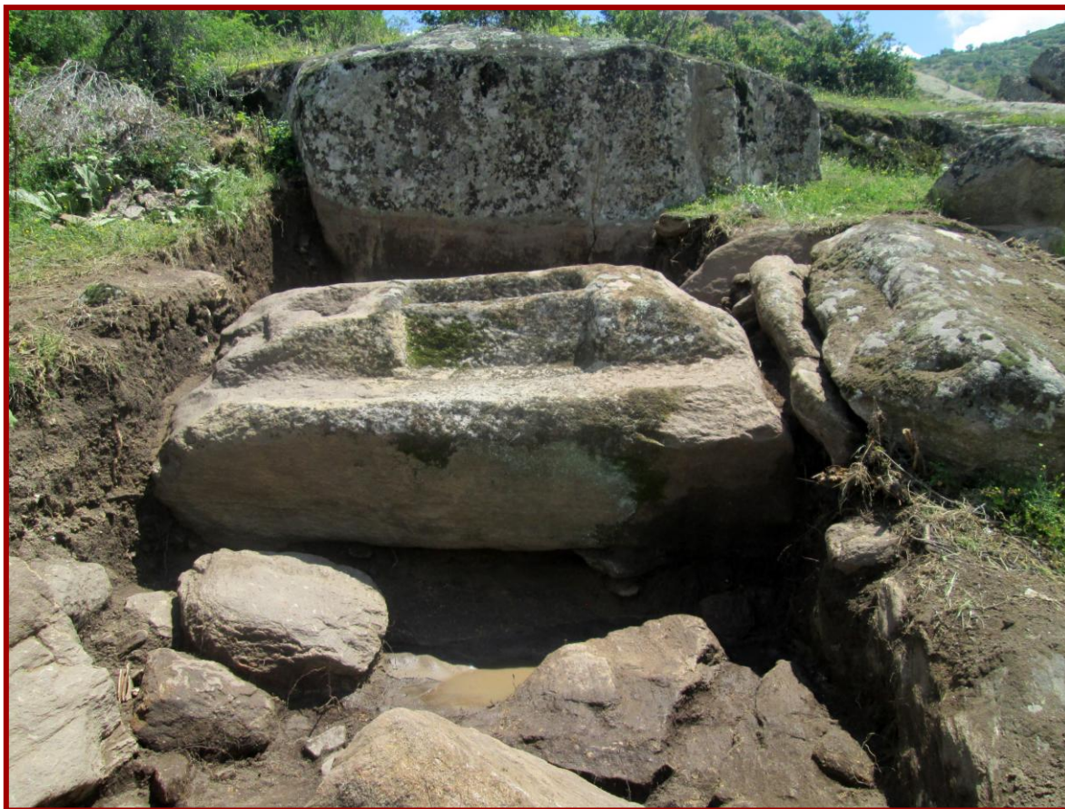
Сл. 2 - Светилиште

На ридот забележителни се поголем број на карпи со видливи интервенции изведени со делкања и вдлабувања. Вертикалните и хоризонтални засекувања, како и неколкуте скалести форми, веројатно биле со цел прилагодување на карпите за нивно вклопување во рамки на градби. Но, кај неколку од нив може да се насетат оформување на форми како посебни културни целини со култна намена. Со истражувањата се добија одредени сознанија за две позиции на кои во подалечното минато веројатно се изведувале некакви ритуални процесии. Пред сè, самиот изглед на обработените карпи на двете места наведуваат кон оваа претпоставка.