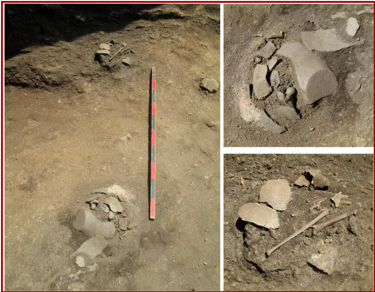
Сл. 5 - Позиции со садови и остеолошки остатоци

поконкретно. Можеби станува збор за гробен наод, но не се исклучува да е тоа жртвено погребување на мртво новороденче, а во рамки на култната процесија.