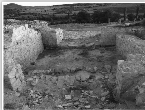
Сл. 5 - Североисточна порта снимена од североисток Надворешен и внатрешен влез во портата

Портата е откриена со систематските археолошки истражувања во 2008 и 2009 година 17 . Портата е сместена е во северозападниот дел на североисточниот одбранбен ѕид, меѓу кулите 7 и 8. Растојанието од кула 7 е на 18 м, а од кула 8 е помало и изнесува 15. Овие растојанија биле доволни за да биде портата бранета од истурените кули (сл.5).