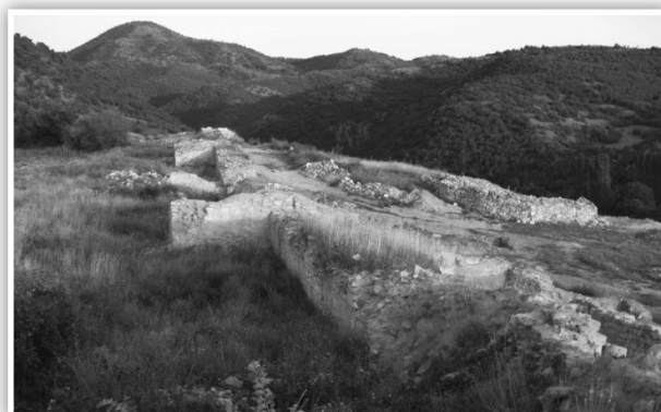
Сл.4 - Североисточен одбранбен ѕид заедно со кула 7, 8 и 9

Археолошките истражувања на североисточниот ѕид се започнати во седумдесеттите години од страна на Алексова Б., при што е откриен мал дел од надворешната фасада на куртината, во близина на југоисточната кула. 16 Во 2001 години, при истражувањето на северозападната кула е откриена куртината Е во должина од 20 м. Археолошките истражувања на овој дел од фортификацијата продолжија во 2007, 2008 и 2009 година. Во текот на овие истражувања, одбранбениот ѕид е откриен во должина од 230 м. (сл. 4), заедно со североисточната порта и одбранбените кули 7, 8, 9 и 10, поставени на меѓусебно растојание од 42 до 40 м.