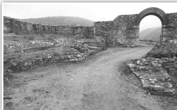
Сл.3 - Надворешен пропугнакулум