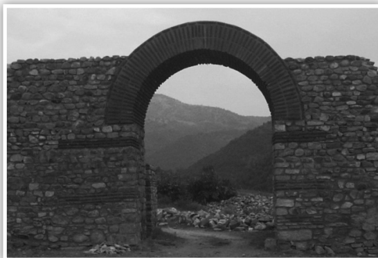
Сл.2 Главна порта (Принципалис)

Со археолошките истражувања во 1995 и 1996 година, целосно е откриена главната порта во градот Бургала (сл. 2).