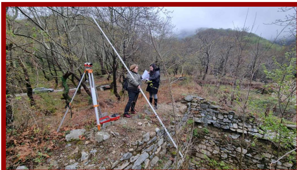
Fig 7. Изработка на проект за конзервација на Пирг кулата - с.мокриево

Во 2023 година од страна на НУ Завод и Музеј Струмица се изготви проект за конзервација на оваа кула ( fig.7,8 ). Со реализација на овој проект ќе добиеме уште еден споменик на културата кој ќе биде презентираан пред пошироката јавност, поврзан со историските случувања во овој дел на Македонија, како во времето на доцната антика, така и во времето на Самуиловите војни и средновековието.