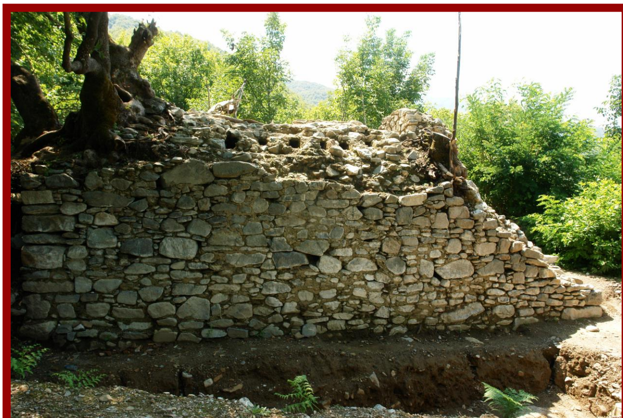
Fig 3. Источно лице на Пир кулата во с.Мокриево

метри. Дел од основата на кулата бил поставен на самата карпа, а нејзината најголема сегашна висинска зачуваност е околу 7 метри (fig.3). Таа до неодамна била многу посочувана од состојбата што ја имаме денес, имајќи го во предвид и податокот од месното население, дека оваа кула била каменолом од кој тие собирале камења со кои ги граделе нивните куќи, оградни, штали, воденици и др.