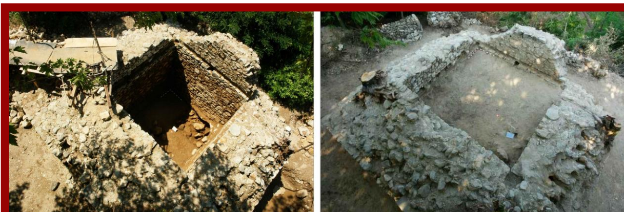
Fig 2. Археолошки истражувања на Пирг кулата - с.Мокриево (2011-2012)