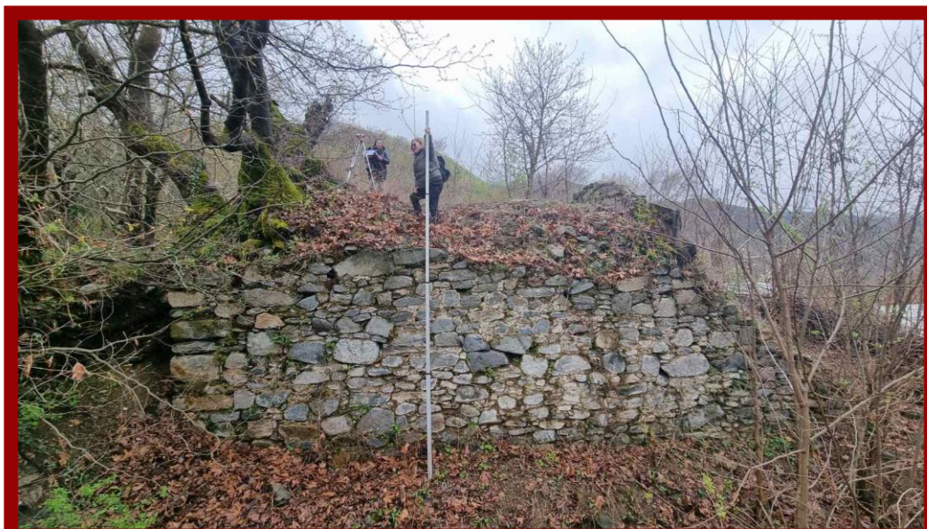
Fig 8. Изработка на проект за конзервација на Пирг кулата - с.мокириево

Градењето на кулата е изведено во градежна техника opus incertum , од кршен камен. Ширината на сидовите е различна и таа се движи од 2.85 до 2.95 м. Во внатрешните лица на кулата (источното, западното и јужното), исто така и во надворешните фасади (северна и јужна), видливи се лежишта за греди од сантрач систем. За врзивно средство меѓу камењата во супструкцијата и во јадрото, бил користен варов малтер.