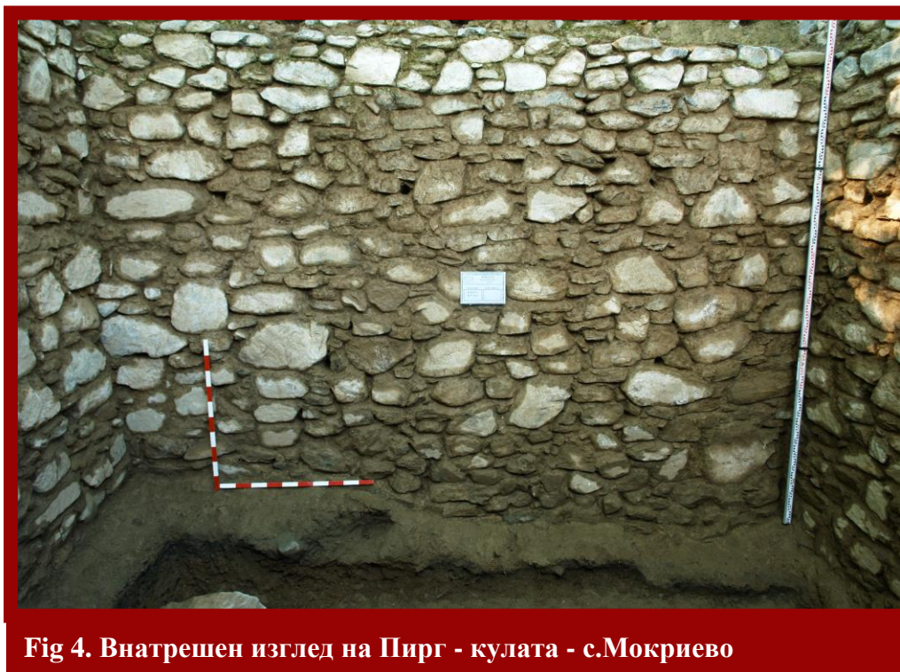
Fig 4. Внатрешен изглед на Пирг - кулата - с.Мокриево

под бил изведен од набиена земја (fig.4,5).