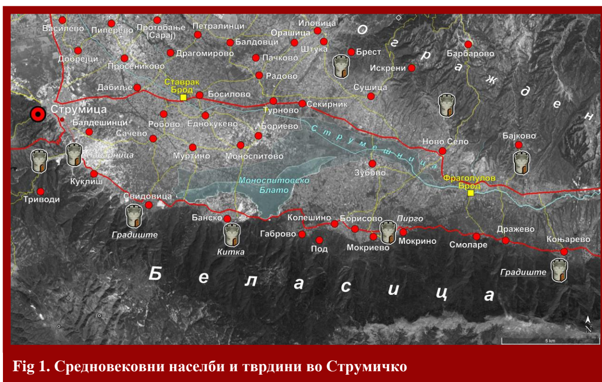
Fig 1. Средновековни населби и тврдини во Струмичко

тоа и до директни судири. 1 На овој потег, од Клуч до Струмица, денес има археолошки остатоци од поголем број на тврдини. Тоа се локалитетите: Марково Кале - с.Старо Коњарево; Пирго - с.Мокриево; Св.Илија – с.Мокриево; Китка – Мал Кајаси - с.Банско; Клисо - с.Свидовица и Падарница - с.Куклиш ( fig.1 ) Овие се тврдините кои досега ѝ се познати на стручната јавност. 2 Сите овие тврдини опстојувале во различни периоди, а, најверојатно, дел од нив имале активности и во периодот кој е предмет на ова истражување. Добро зачуваните доцноантички тврдини и помали фортификациони објекти биле делумно обновени и активирани во дефанзивниот систем на Самуил.