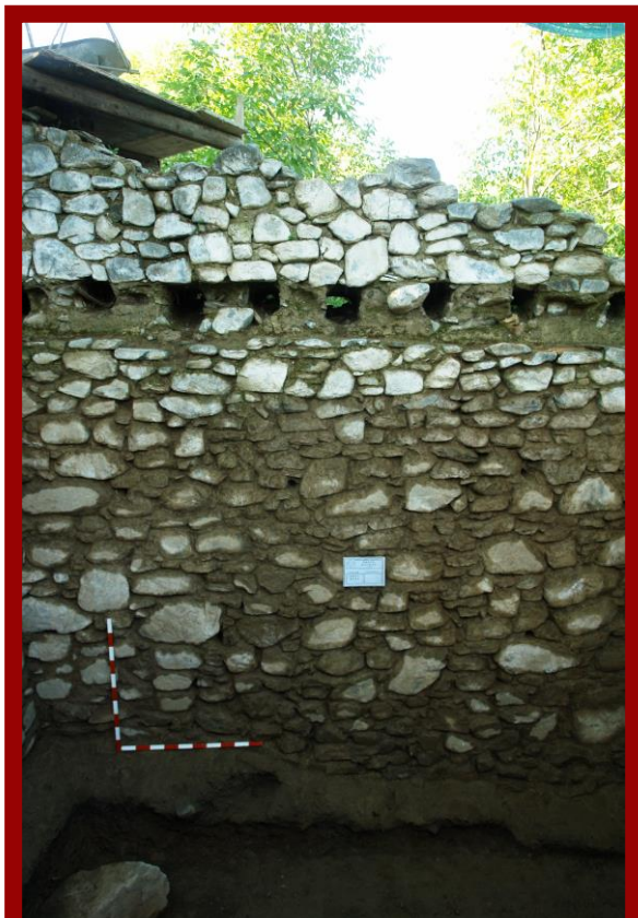
Fig 5. Внатрешен изглед на Пирг кулата, со лежиштата за греди - с.Мокриево

Со археолошките истражувања на кулата беа откриени скромни остатоци од движни наоди кои, сепак, дозволуваат да сметаме дека кулата имала определена улога сè до средниот век. За тоа сведочи наодот од глава на прстен во вид на антропоморфен штит за кој даваме широка датација во периодот XIV – XVI век, пронајден со истражувањата од надворешната страна на кулата. 11 Според Зоран Рујак, веројатно кулата била користена и во текот на доцниот среден век, а на тоа укажуваат и движните наоди, пред сè, фрагментот глеѓосана керамика, како и средновековното погребување откриено покрај неа.