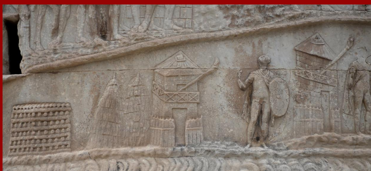
Fig 6. Трајановиот столб (113 година), Римска граница на десниот брег на Дунав, стражари и караули со сигнал

По уништувањето на Самуиловата држава голем број на тврдини наполно и засекогаш исчезнале, како можни идни упоришта против ромејската власт. Оттука произлегува и веројатноста дека тогаш и тврдината Мацукион, која е предмет на ова истражување, била разурната. Кулата останала функционална со периодични прекини се до доцен среден век кога најверојатно била срушена од страна на Османлиските власти. Оттогаш за неа останале да сведочат само преданијата на месното население.