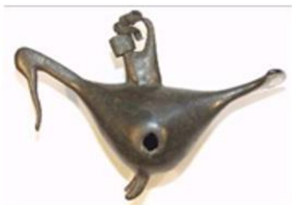
Сл.1 – Птица- висулец

Во гробот бр.10 исто така форма од развлечени камења со малку зачуван остеолошки материјал се откриени: мало бронзено бокалче (Т.П.сл.3), бронзено садче во форма на афионова чашка ( Т.П.сл.5), мало калотно копче и 3 висулци во форма на латинската буква V. Малото бокалче и афионовата чашка припаѓаат на категоријата култни бронзи како инструменти на култот.