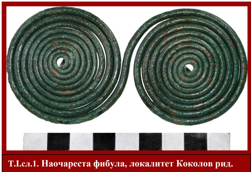
Т.І.сл.1. Наочареста фибула, локалитет Коколов рид.

Наочарестите фибули чија егзистенција се ограничува до длабоко во втората половина на VII век пр.н. е. во услови на конзервативност сепак продолжува со поедноставена форма и се провлекува уште еден век на нашите простори.