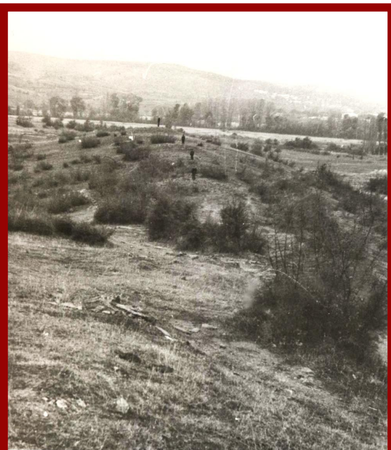
Сл.1. Археолошки локалитет Коколов рид, фотографија од 1978 год.