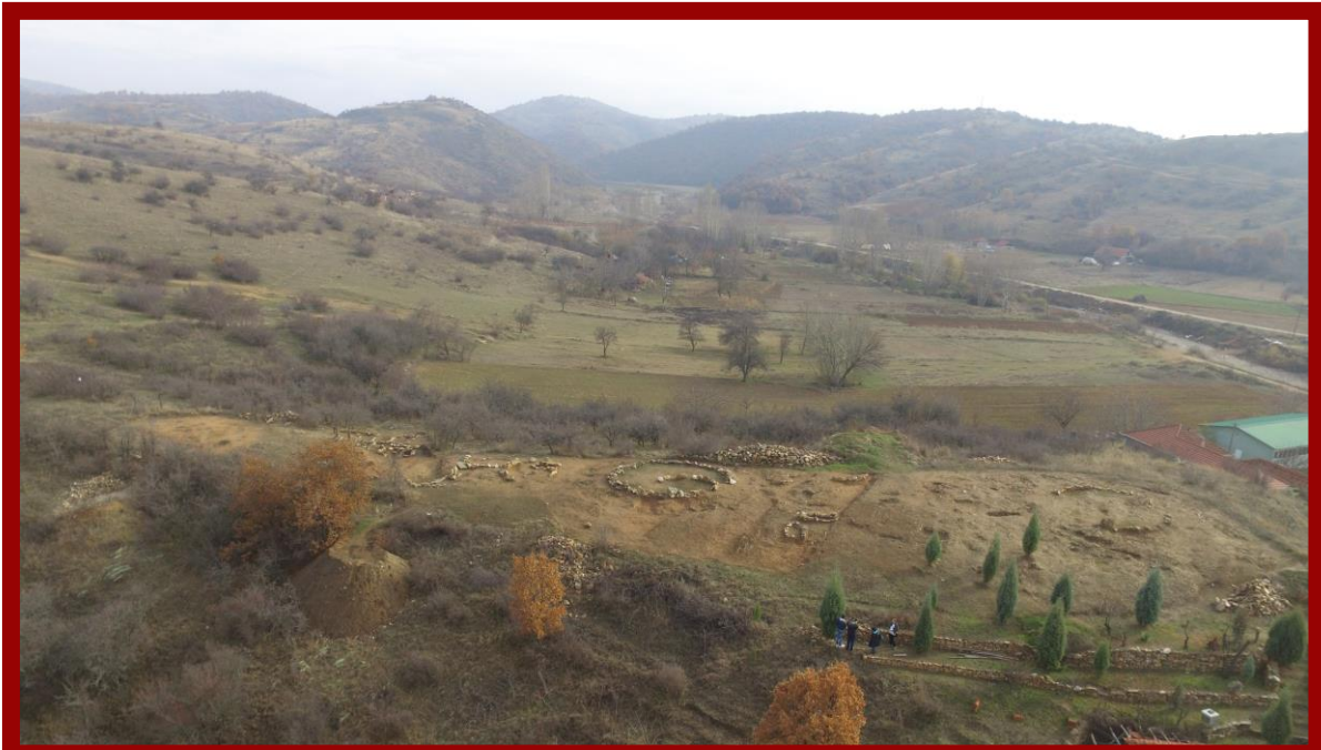
Сл.2. Археолошки локалитет Коколов рид, 2016 год.

По подолг временски период од 30 години во 2011 година стручната екипа од Локалниот археолошки и историски музеј „Теракота“- Веница започна со заштитни археолошки истражувања на локалитетот тумуларна некропола - Коколов рид (Барбошки дол) (сл.2). Со извесни прекини истражувањата се вршеа до 2022 год.