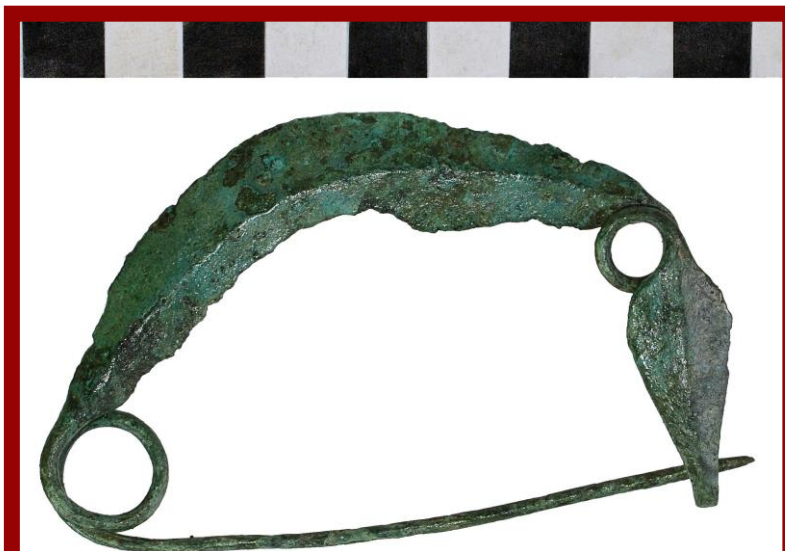
Т.І.сл.4. Фибула со лак во облик на врбов лист, локалитет Коколов рид.

Од овој период се и двете еднонавојни лачни фибули со плочест асиметрично речиси правоаголен облик на ногата и копјесто продолжение кон