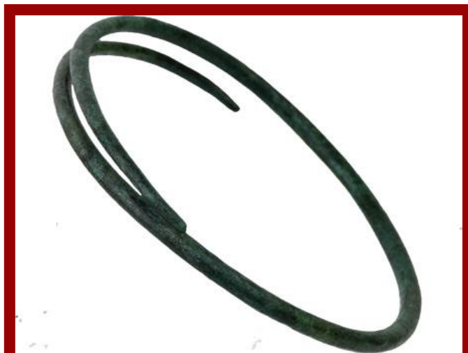
Т.І.сл.6. Белегзија од жица со преклопени краеви, локалитет Коколов рид.

Такви се белегзиите откриени на локалитетите Кршлански гумења кои се датирани