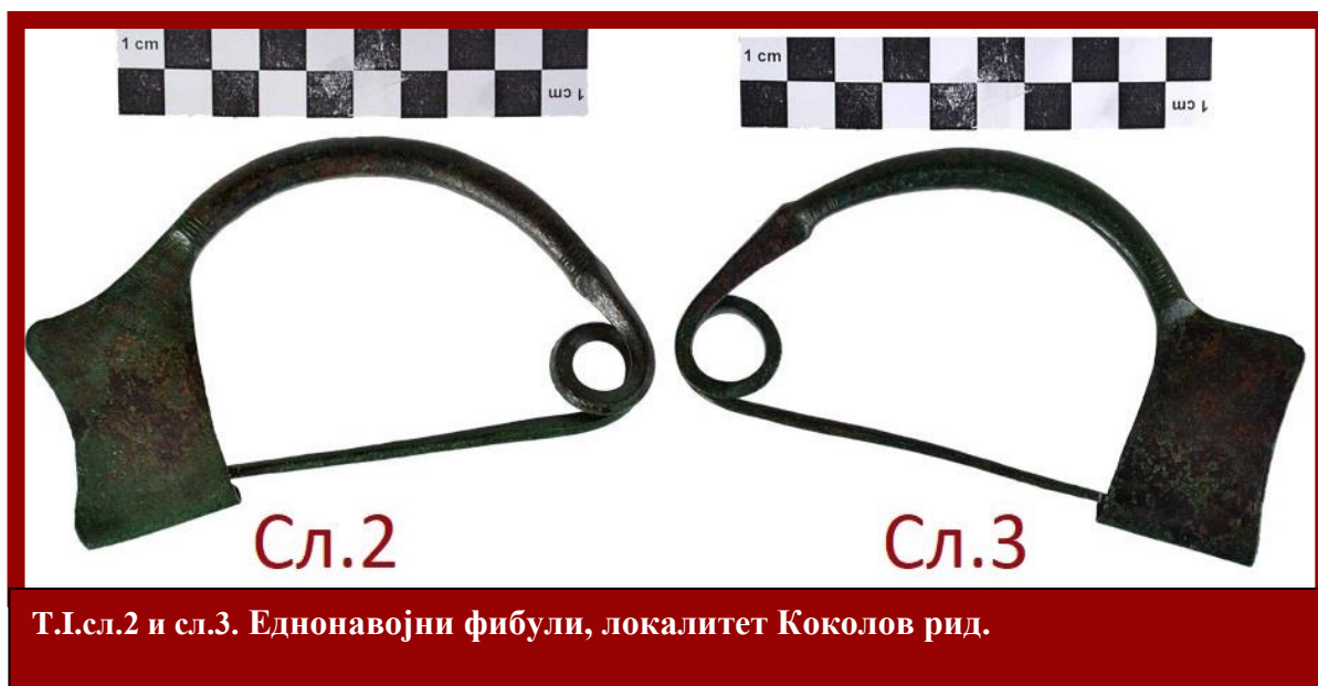
Т.І.сл.2 и сл.3. Еднонавојни фибули, локалитет Коколов рид.

навојот (Т.І.сл.2 и 3). Откриени се во гробот бр.3 во тумулот број 1 на Коколов рид со белегзија со преклопени краevi и прстен од тенка жица. Може да се каже дека припаѓаат на постарата фаза на железното време .Овој т.н. тракиски тип на фибула се среќава во погребување под мали хумки на локалитетот Криви дол с. Радање, Штип која е датирана во VIII-VII пр.н.е. (Vasic 1987; 692-693, сл.39, 10 ). Се смета дека потекнуваат од т.н.островски тип-геометриски фибули во Грција кои во внатрешноста на Балканот ги нема. Се сметаат за локален продукт карактеристичен за VII век пр.н.е. ( Нацев 1993,117).