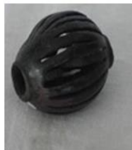
Сл.2 – Приврзок - Ажурирана топка