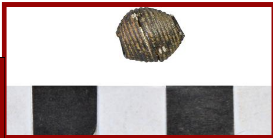
Сл.4. Приврзок од гроб циста, локалитет Гробана.