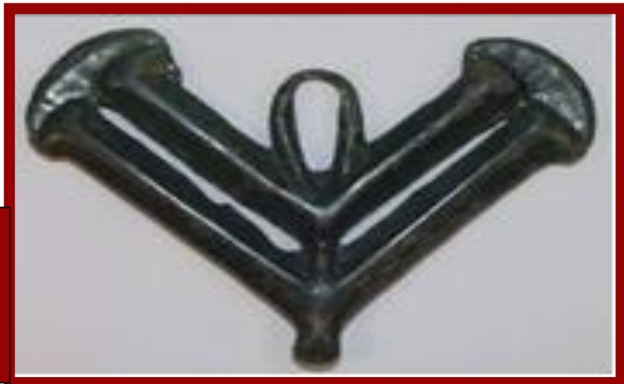
Т.П.сл.4. Висулец во облик на латинската буква V.

Анализирајќи го материјалот и гробните конструкции на локалитетот Кршлански гумења може да се констатира дека трите гробови со развлечени групи на камења во кои спаѓаат и гробот бр.1 и гробот бр.10 се од времето на VII век пр.н.е. и дека имаат директни паралели со гробовите од локалитетот Криви Дол кај с. Радање кај Штип. Аналогиите се и со културниот инвентар што се наоѓа во нив. Култните бронзи откриени во гробовите припаѓаат на севернопајонската група на култни бронзи.