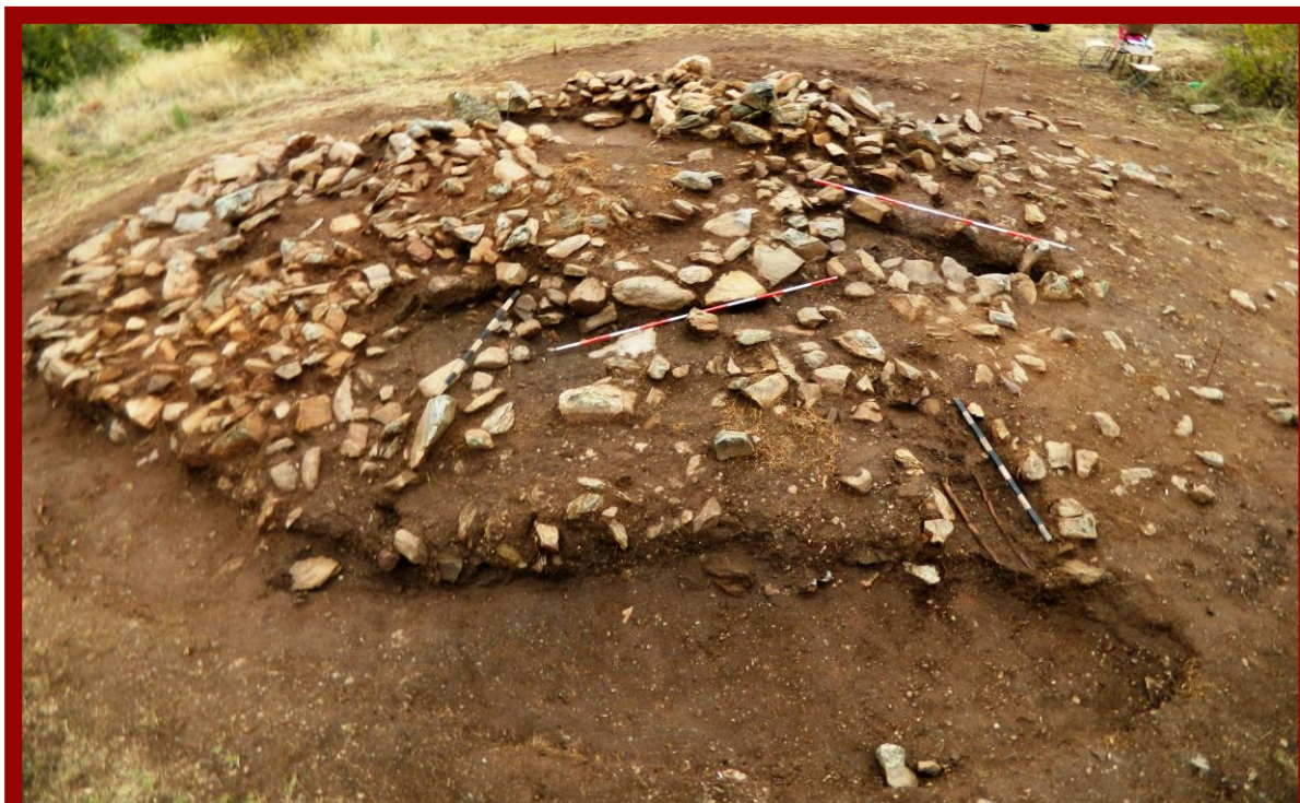
Сл.3. Тумул бр.1, Коколов рид, Погребувања од VIII-VII пр.н.е.

Резултатите од истражувањата потврдија дека се работи за доста комплексен локалитет во врска со неговото користење и датирање, како некропола во праисторијата и римскиот период и простор каде биле вршени ритуални култни дејствија што го дефинираат и како светилишен простор во раното бронзено и раното железно време (Иванова 2020, 241).