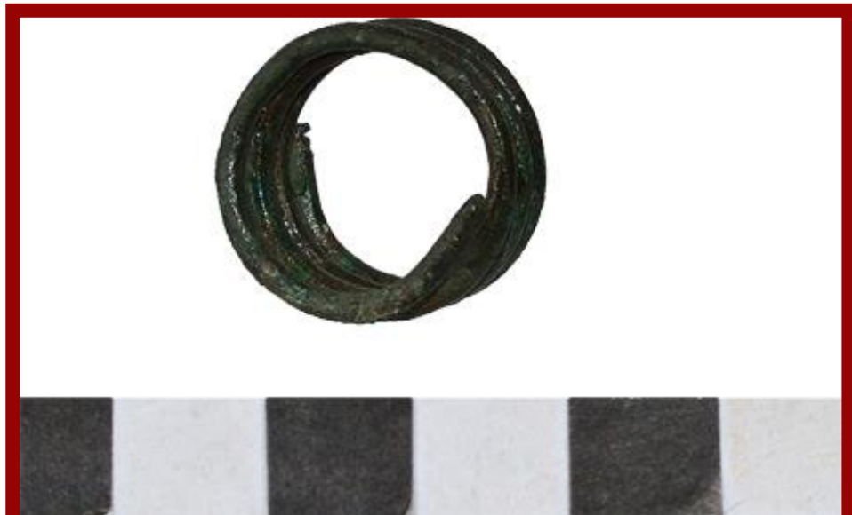
Т.Г.сл.7. Приврзок во форма на лабрис, локалитет Коколов рид.

вратот, како елементи на ѓердан. Нивната употреба се следи низ целото рано и полно железно време. Во нашиот случај датирањето со наодите во гробовите е VIII - VII век пр.н.е.