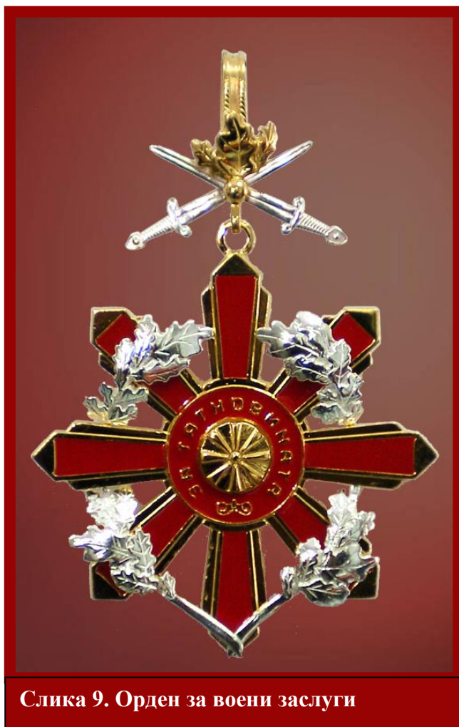
Слика 9. Орден за воени заслуги

- на воени и полициски единици и установи за повеќегодишно успешно работење и постигнување особени резултати во развивањето и јакнењето на безбедносните сили и вооружените сили во Република Македонија и