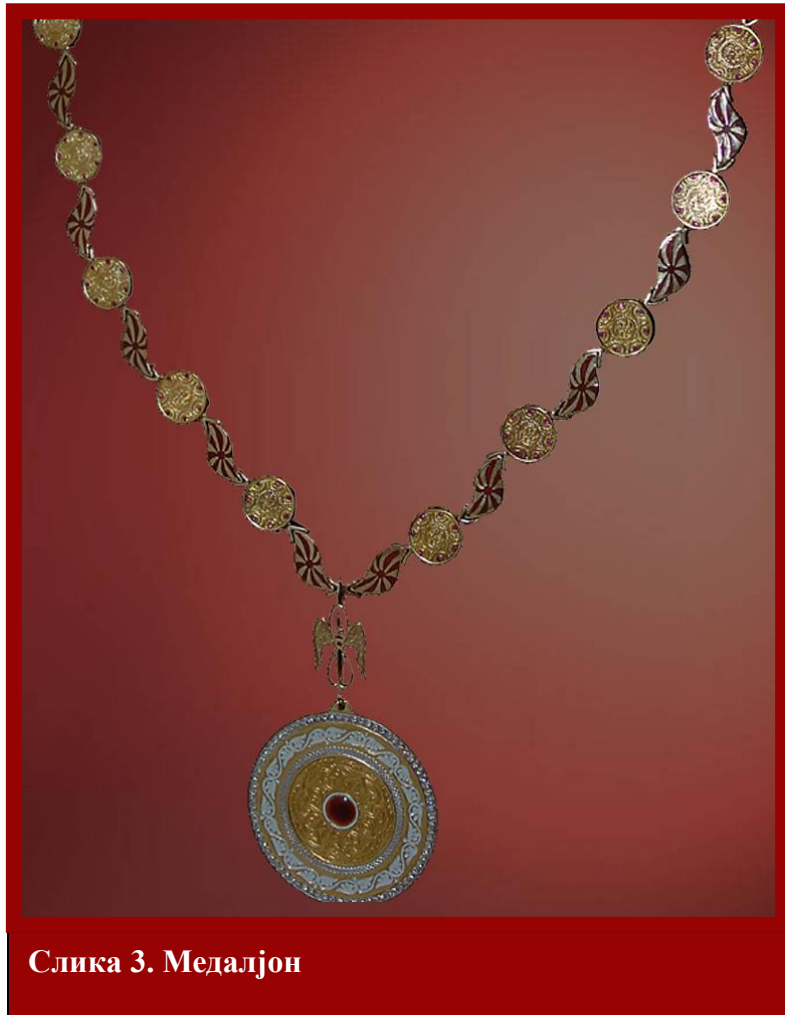
Слика 3. Медалјон

Третиот сегмент е најраскошен, и претставува прстен широк 12 мм кој е обрабен од двете страни со по 3мм раб во родиумска преслека. Надворешниот обраб е украсен со 77 брилијанти со димензија од 1,5 мм. Во овој сегмент има плетенка опточена со бел топол емајл. Медалјонот е со дебелина од 1,7 мм и тежи 51 гр (сл. 3).