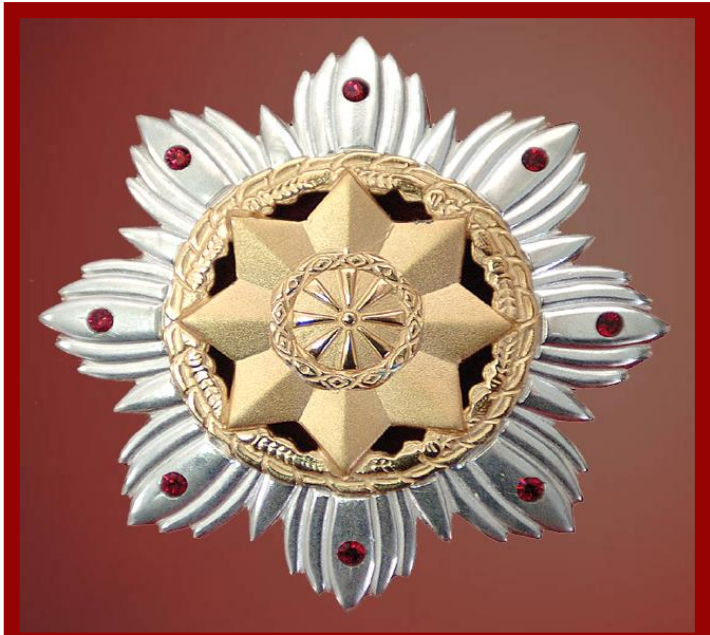
Слика 8. Орден за заслуги на Македонија

- на странски државјани и странски установи и организации за особени заслуги за сувереноста, независноста и територијалниот интегритет на Република Македонија за успешно организирање и ефикасно остварување на функциите на органите на државната власт, за особено значајни остварувања во стопанството, образованието, науката, културата, иноваторството, здравството, соци-