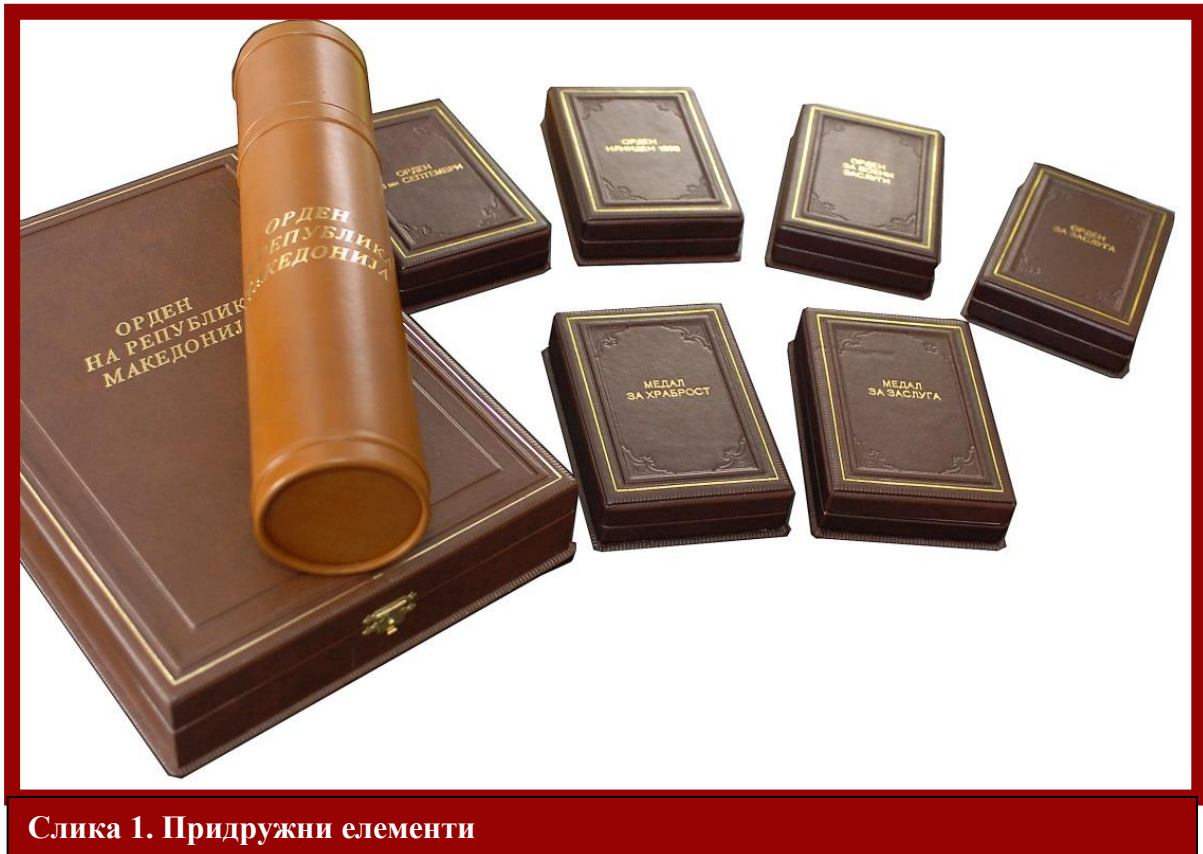
Слика 1. Придружни елементи