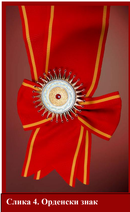
Слика 4. Орденски знак

Орденската ѕвезда е идентична со медалјонот, но од кружниот диск се одвојуваат 30 зраци, а на секој зрак има по еден рубин од моделот кабашон со димензија 2,7 мм, кој асоцира на афионовите чушки. Вкупната димензија е 91 мм, со дебелина 2,3 мм и тежи 101 грам. Орденската ѕвезда се носи на црвена лента широка 105 мм, која на краевите има две жолти линии и е изработена од маорирана свила. Лентата е со вкупна должина од 188 сантиметри. На крајот на лентата има аплицирана црвена двојна розета со димензии 20 на 20 сантиметри, каде што се аплицира орденската ѕвезда. Орденскиот знак се носи околу вратот на ѓердан (сл. 4).