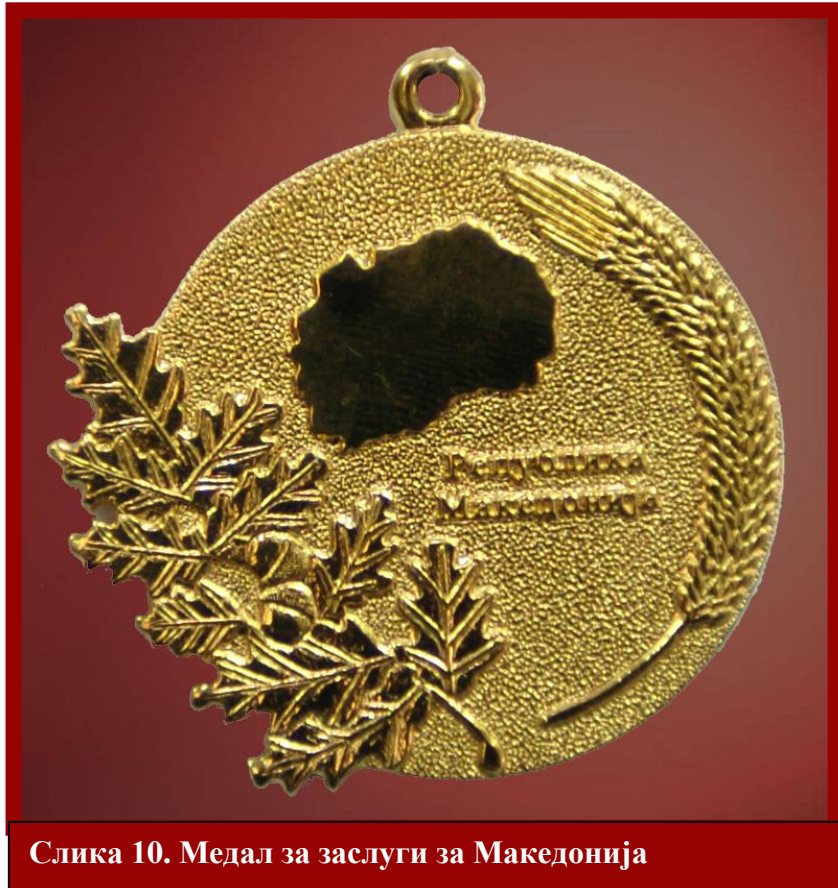
Слика 10. Медал за заслуги за Македонија

Медалот се доделува на физички и на правни лица за постигнати резултати што придонесуваат за значаен развој и афирмација на Република Македонија во сите области на животот и работата, како и за развивање пријателски односи меѓу Република Македонија и други држави, меѓународни органи, организации или асоцијации.