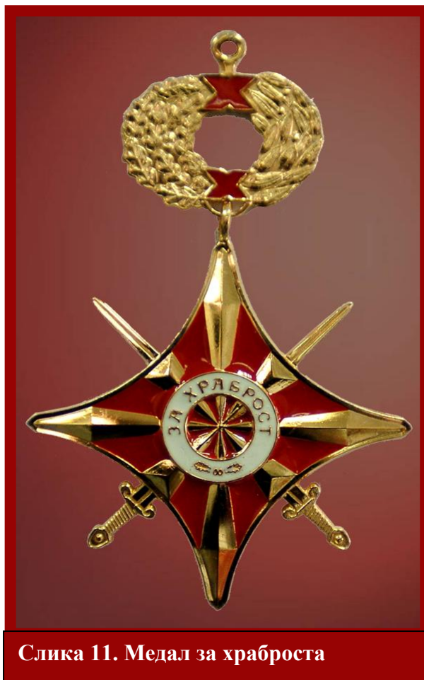
Слика 11. Медал за храброста