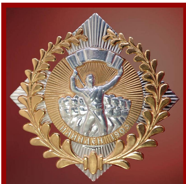
Слика 7. Орденска звезда