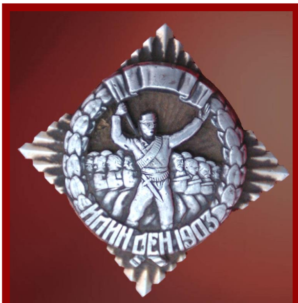
Слика 6. Орден „Илинден“