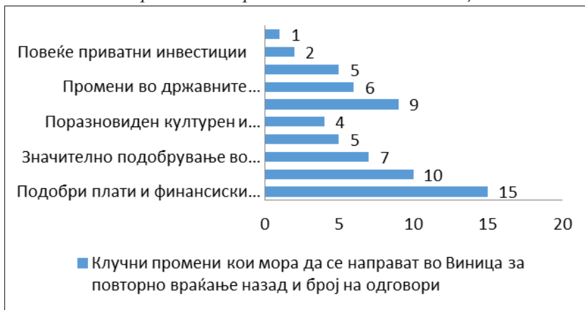
Слика 4: Што треба да се промени во општина Веница?