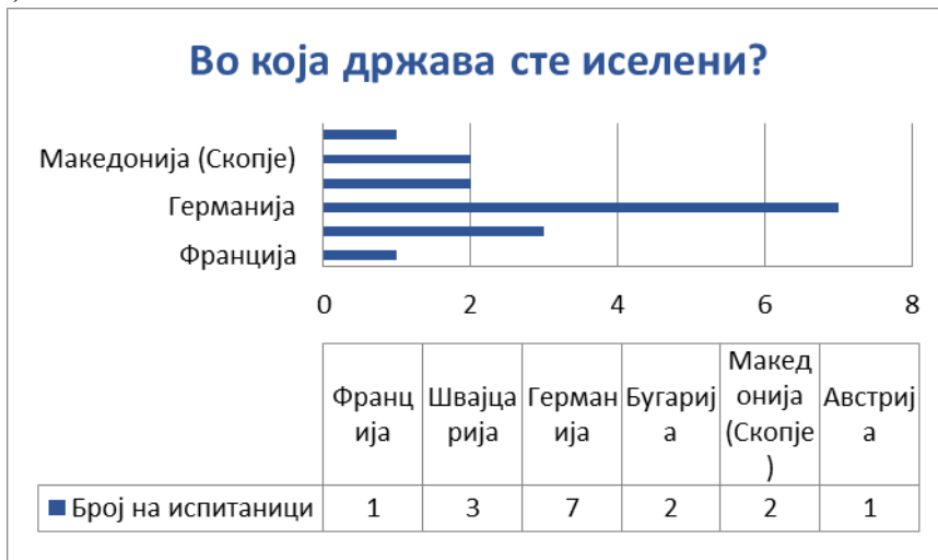
Слика 3: Приказ на држави (градови) во кои се иселени граѓани од општина Веница