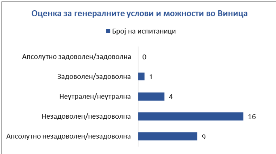
Слика 1: Перцепција за условите и можностите кои ги нуди општина Веница