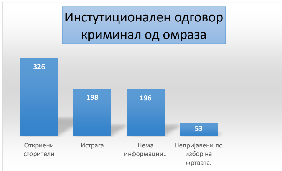
Слика 6: Правна разрешница на инциденти на криминал од омраза во период од 2013 до 2020 година