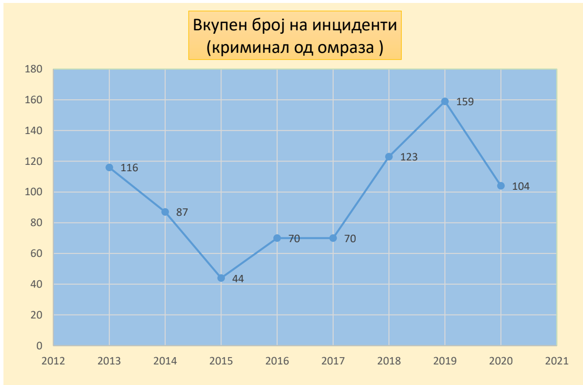
Слика 1: Вкупен број на инциденти на криминал од омраза во период од 2013 до 2020 година

Гледано по години најголем број на инциденти поврзани со криминал на омраза се случиле во 2019 година и тоа вкупно 159 случаи (прикажано на слика 1). Според вид на инцидент најчесто е насилството со учество од 234 настани а не заостануваат и телесните повреди со 182 настани (слика 2 ). Најчесто инцидентот е по основ на етичка припадност со застапеност од 66% (слика 3).