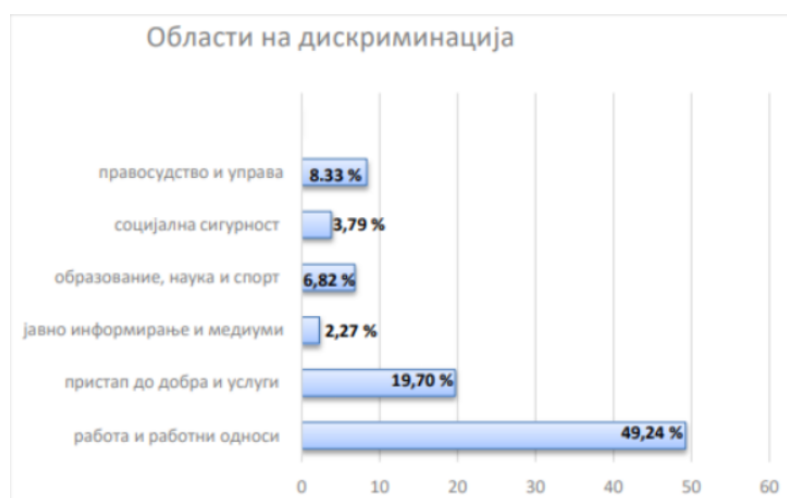
Слика 2: Комисија за заштита од дискриминација - Истражување 2018 год Области на дискриминација

Најмногу претставки се поднесени поради дискриминација врз основа на личен и општествен статус – 25%, политичка припадност – 21,97%, здравствена состојба – 9,09%, пол – 9,09 %, припадност на маргинализирана група – 8,33%, етничка припадност – 7,58%, возраст – 6,06%, ментална или телесна попреченост – 3,79%, род – 3,03%, семејна или брачна состојба – 3,03%, религија или верско уверување – 2,27%, сексуална ориентација – 2,27% итн.