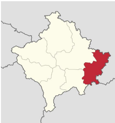
Карта 1. Регионот на Ана Морава во рамките на Република Косово. Извор: Завод за статистика на Косово (изменето од П.Кахили).

Општина Каменица се наоѓа на исток од Косово, која се граничи на југозапад со општина Ранилуг, на запад со општина Ново Брдо, на северозапад со Приштина, на север со општина Медвеѓа и Лесковац, на исток со Врање, и на исток и југоисток со Бујановац.