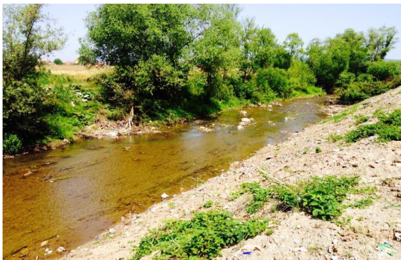
Слика 2. Река Морава е Бинчес (автор П.Кахили)

Дел од селата на општина Вити се без канализациона мрежа. Најлоша е состојбата во селата Гошица, Садовина, Бинче, Смира, Бегунча, Радивојц и Стубел, но дури и во населените места каде што има канализациона мрежа нема соодветно место за испуштање на отпадните води, во некои локалитети се отворени септички јами но повеќето од населените места ја испуштаат канализацијата во реката Морава е Бинчес. Морава е Бинчес прифаќа загадена вода со испуштање на 25.000 жители. 86