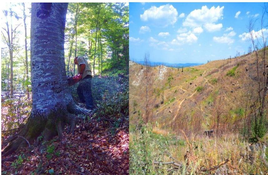
Слика 1. Состојба на шумите (планината Карадак) пред и по неконтролирано сечење од страна на граѓаните на општина Вити и пограничните области на Република Македонија (автор П. Чахили)

Прашањето за обезбедување чист воздух е суштински поврзано со здравјето на луѓето, индустрискиот развој, согорувањето на фосилни горива и драстичното зголемување на сообраќајот дополнително го зголемија загадувањето на воздухот во градот Вити и другите населени места, што пак може да предизвика сериозни здравствени проблеми. Паралелно со здравствените проблеми со закиселувањето во последниве години, осиромашувањето на озонскиот слој и климатските промени, исто така, како резултат на глобалното затоплување, претставуваат големи социјални проблеми. 84