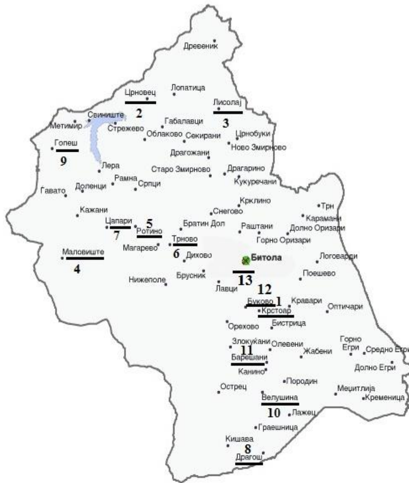
Карта 1. Разместеност на манастири со конаци во Општина Битола Map 1. Location of the monasteries with lodgings in the Municipality of Bitola