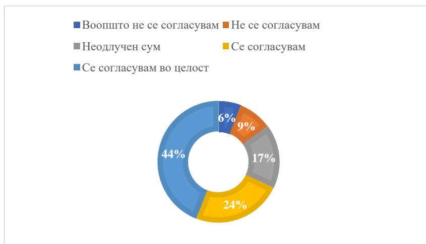
Графикон 2: Резултати од втората претпоставка Chart 2: Results of the second assumption

Втората претпоставка, односно посебна хипотеза гласеше: топ-менаџментот на компанијата следи најмалку три трендови на синџирите на снабдување кои се актуелни во тековната година.