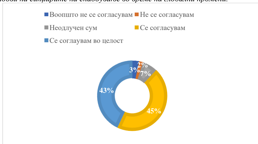
Графикон 3: Резултати од третата претпоставка Chart 3: Results of the third assumption

Третата претпоставка, односно посебна хипотеза гласеше: потребна е дополнителна едукација за современите трендови на синцирите на снабдување во време на глобални промени.