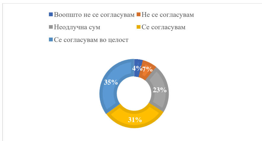
Графикон 1: Резултати од првата претпоставка Chart 1: Results of the first assumption

Првата претпоставка, односно посебна хипотеза гласеше: топ-менаџментот на компанијата е информиран за современите трендови на синџирите на снабдување и корисноста од нивно следење.