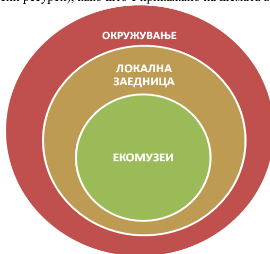
Слика. 1 - Локација на еко-музеј и нејзиното влијание Picture.1- Location of the eco-museum and its impact

Овој тип на музеи имаат изградено нераскинлива врска со локалната заедница и окружувањето (природни и антропогени ресурси), како што е прикажано на шемата во продолжение (Corsane, 2005).